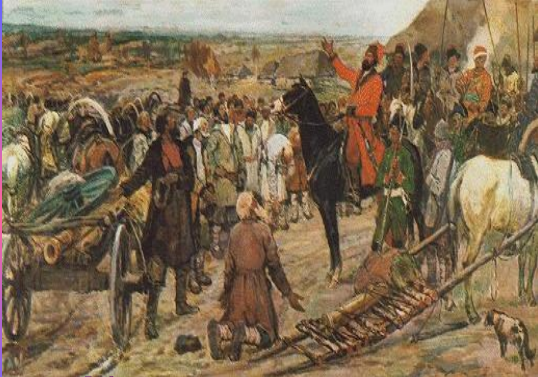
Рабочие уральских заводов привозят пушки Пугачеву