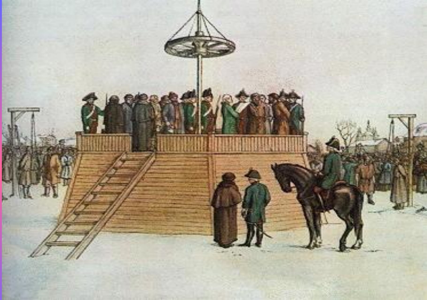
Казнь Пугачева и его соратников в Москве