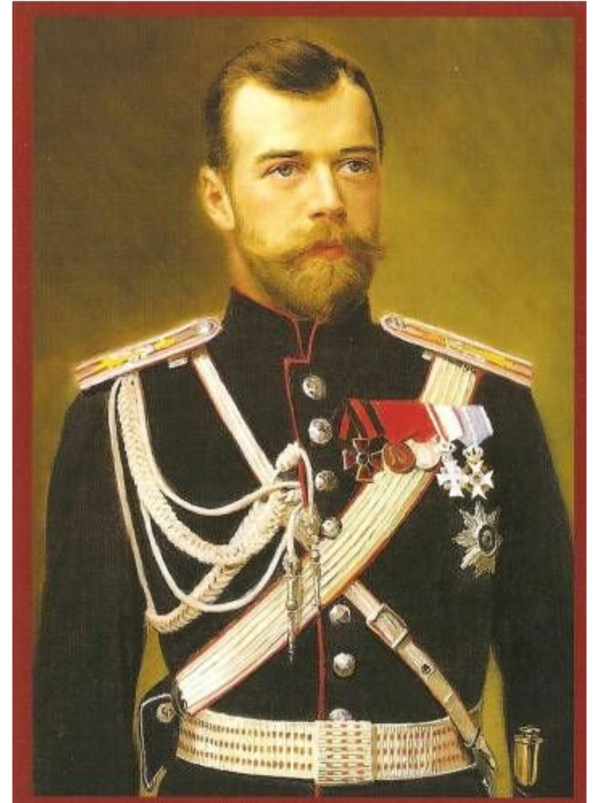
Николай II (1894 – 1917)