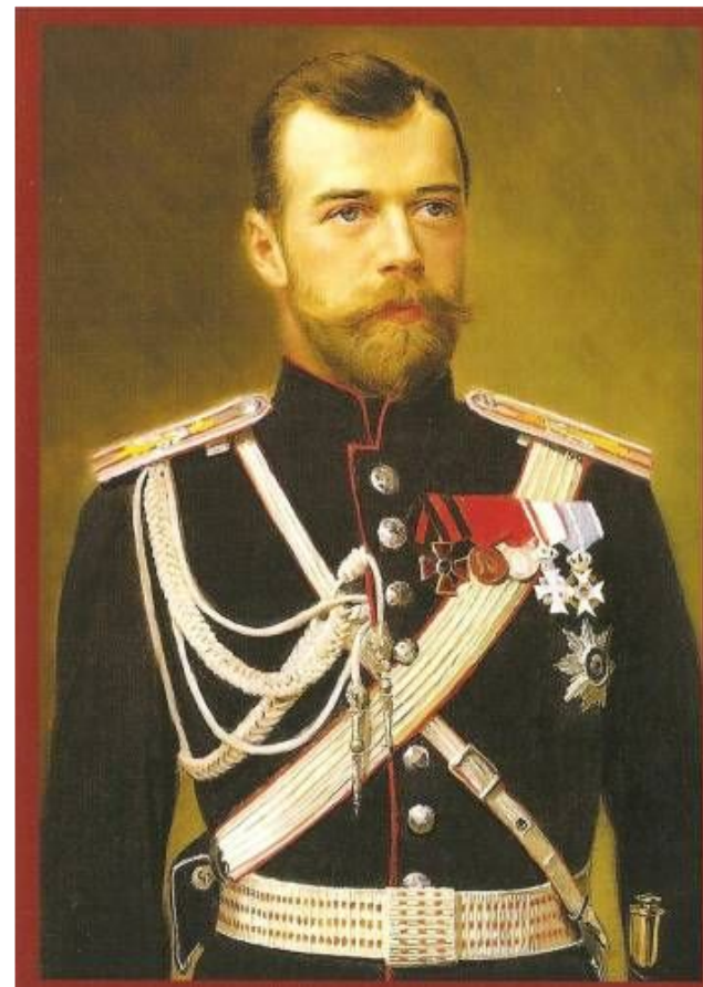
Николай II (1894 – 1917)