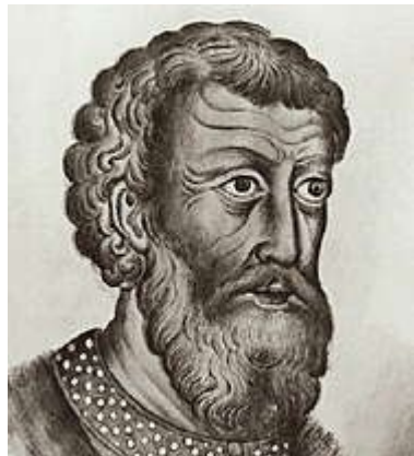
Василий II 1425-1462