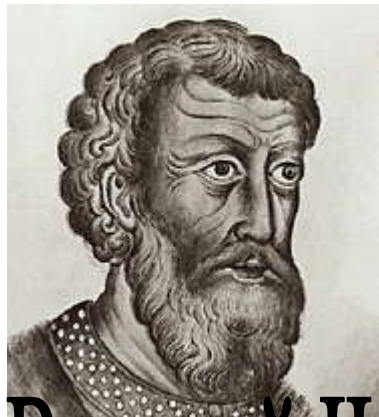
Василий II 1425-1462