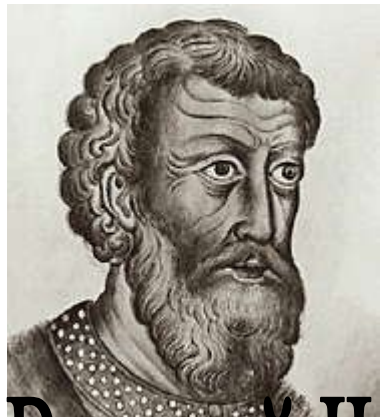
Василий II 1425-1462