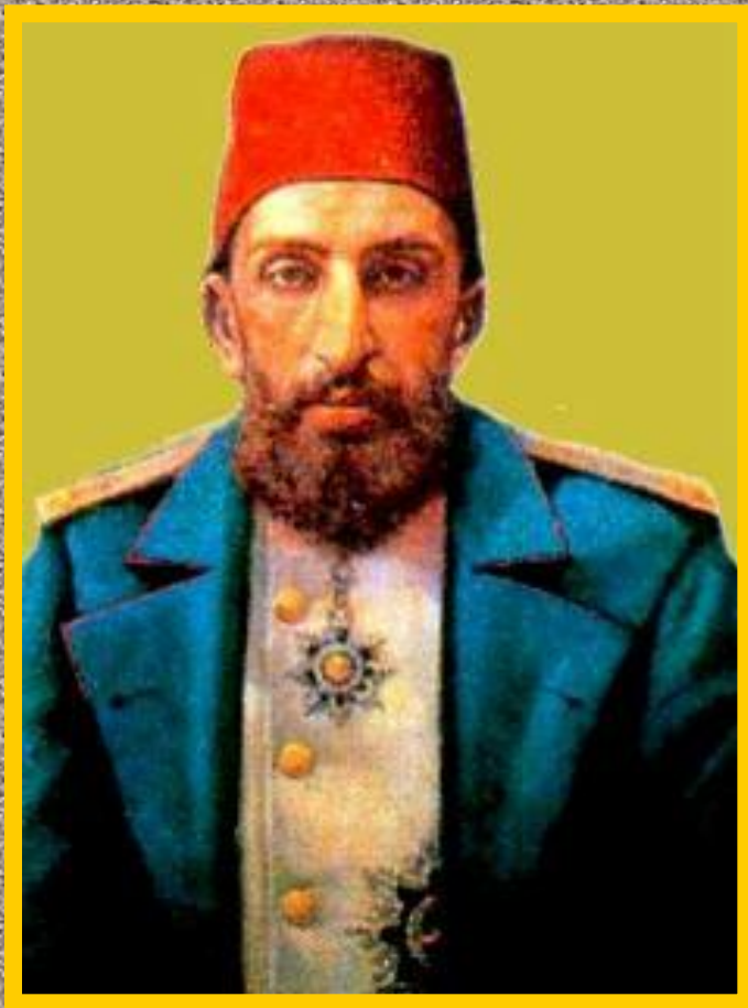
Султан Абдул-Хамид II

В 1839 г. Абдул-Меджид начал «политику реформ»-они затронули армию, финансы, налоги,но этому мешали феодалы.