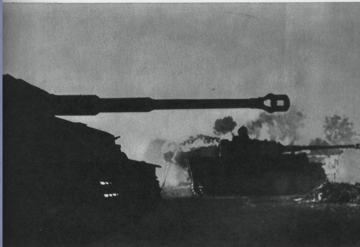
Немецко-фашистские танки на исходных позициях. 1943 г.

«Цитадель» – план немецкой армии – окружение немецкими танковыми соединениями советских войск в районе Курска, а затем наступление на Москву.