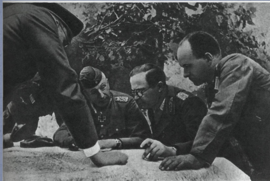
Перед операцией «Цитадель». Справа налево: Г. Клюге, В. Модель, Э. Манштейн. 1943 г.