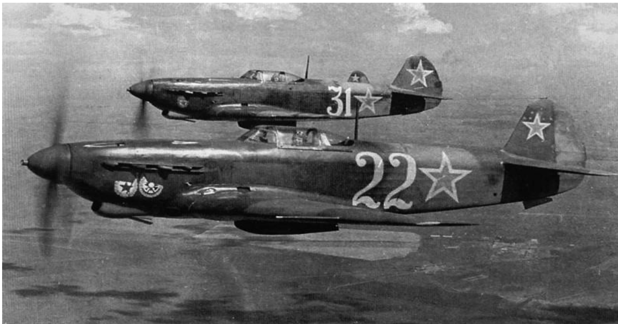
Истребители Як-9Д, 3-я эскадрилья 6-го ГвИАП ВВС Черноморского Флота.