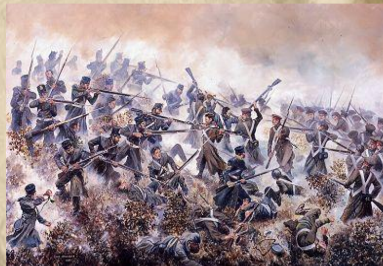
Крымская война. Кампания 1854г.

Обороной Камчатки, где тоже находились незначительные силы, заведовал контр-адмирал Завойко.