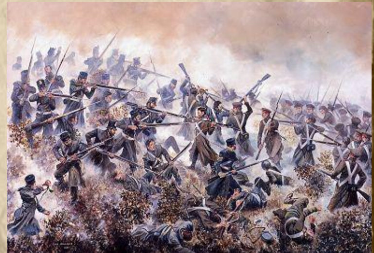
Крымская война. Кампания 1854г.

Обороной Камчатки, где тоже находились незначительные силы, заведовал контр-адмирал Завойко.