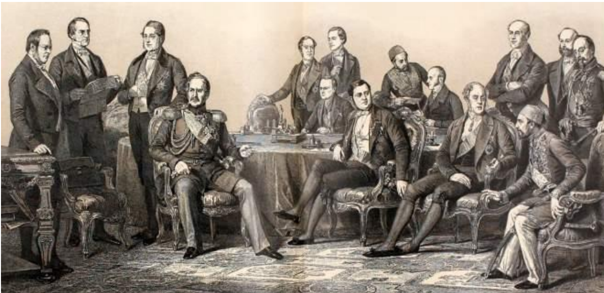
Парижский конгресс 1856 г. А.Бланшар