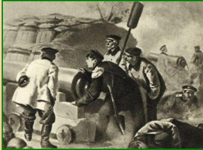
Адмирал П.И.Нахимов на батарее