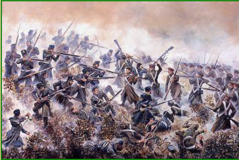
Сражение Крымской войны