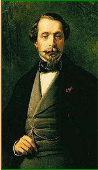
Наполеон III – император Франции