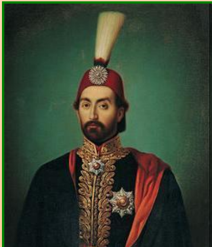
Султан Абдул- Меджид