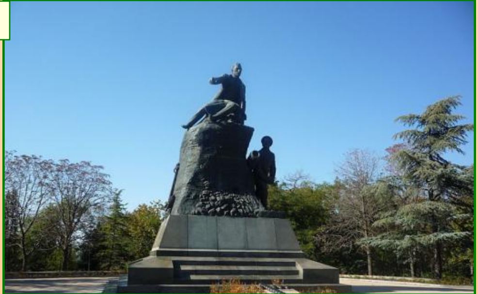
Памятник Корнилову на месте его смертельного ранения

Командующий обороной Севастополя адмирал В.А. Корнилов приказал затопить у входа в бухту корабли Черноморской эскадры, чтобы корабли англо-французской эскадры не могли подойти к городу. Перед затоплением с кораблей сняли пушки и перенесли их на береговые батареи. Вскоре противник начал штурмовать Севастополь.