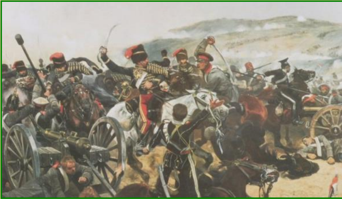
Сражение русской и английской кавалерии

Затягивание боевых действий и большие потери вызывали недовольство в Англии и Франции.