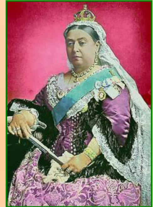
Виктория – королева Англии

Неожиданно для Николая I Англия и Франция заключили военный союз с Турцией и потребовали вывода русских войск из Дунайских княжеств. Не дождавшись выполнения своих требований в марте 1854 г. Англия и Франция объявили войну России.