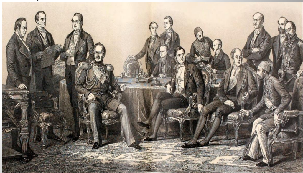
Cavour Cowley Buol Orlov Bourquoy Hilmi Mustafa Walewski Djemil Benedetti Clarendon Brannon Aali Haridick Villamarina