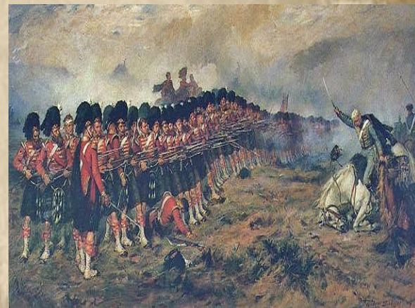
„Тонкая красная линия“

★ 2 (14) сентября 1854 года началась высадка экспедиционного корпуса коалиции в Евпатории. Командование Черноморского флота собиралось атаковать вражеский флот, чтобы сорвать наступление союзников. Однако Черноморский флот получил категорический приказ, в море не выходить, а оборонять Севастополь с помощью матросов и корабельных пушек.