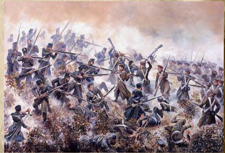
Крымская война. Кампания 1854г.