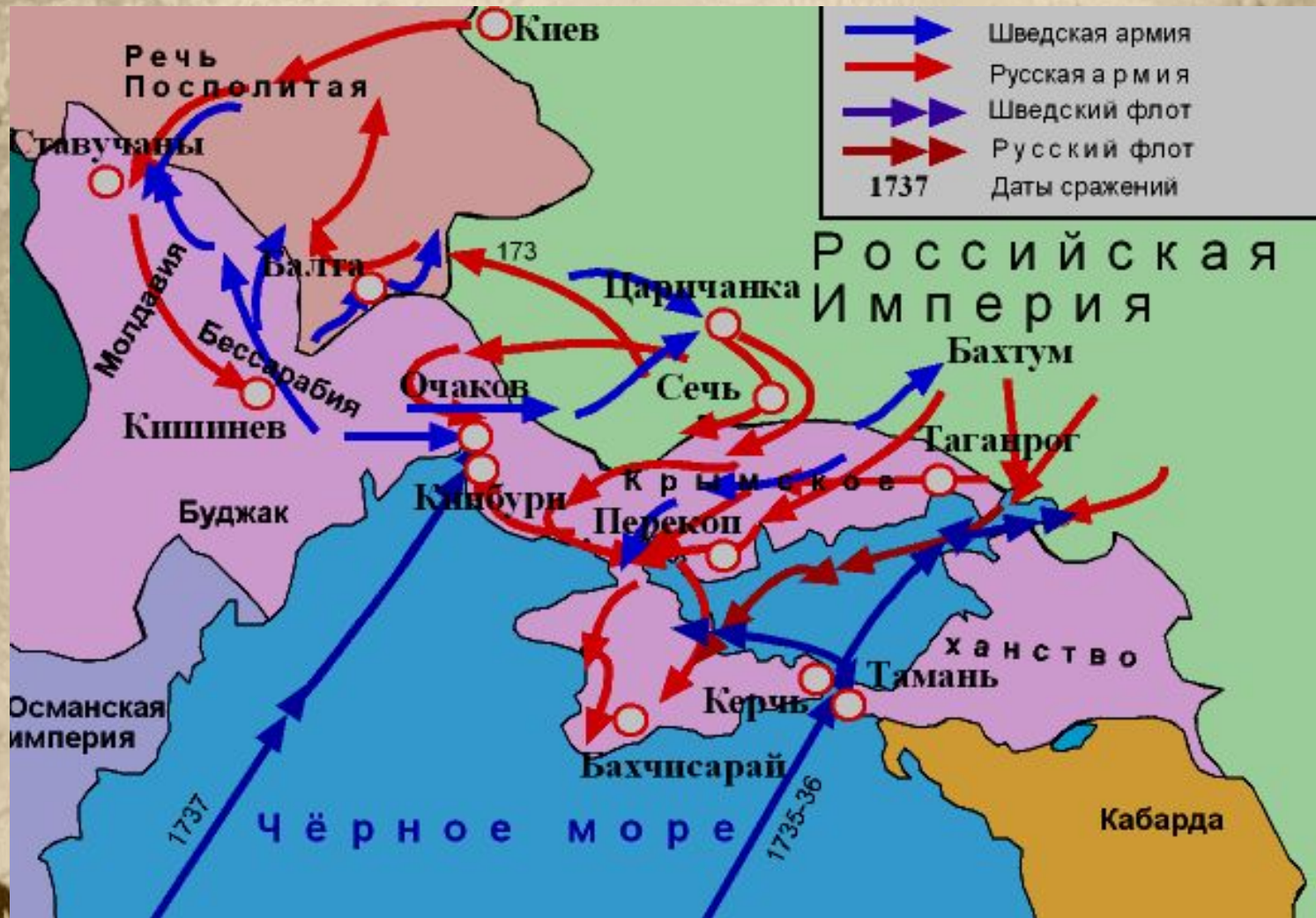
Карта русско-турецкой войны