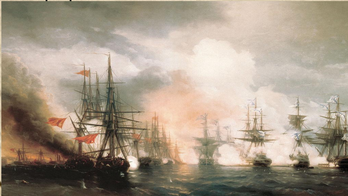
Крымская война 1853-1856 года

Для действий на Балтийском море в 1855 году союзники снарядили 67 судов; флот этот в середине мая появился перед Кронштадтом, надеясь выманить в море стоявший там русский флот. Не дождавшись этого и убедившись, что укрепления Кронштадта усилены и во многих местах заложены подводные мины, неприятель ограничился набегами лёгких судов на разные места финского побережья.