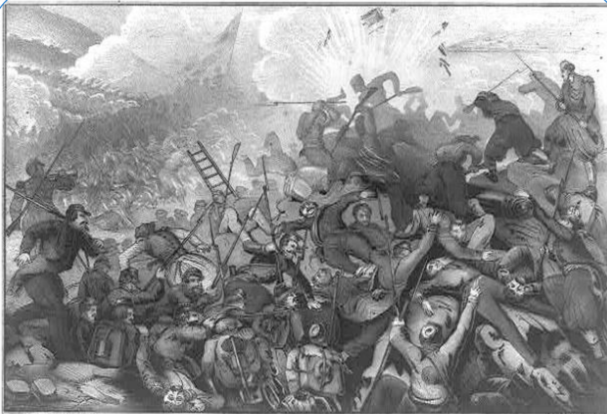
THE FALL OF SEBASTOPOL. CAPTURE OF THE MALAKOFF TOWER