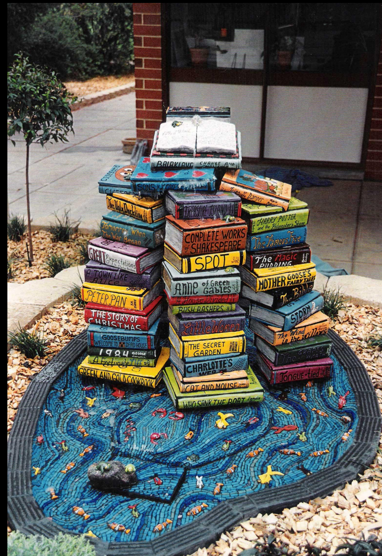
Памятник на Балаклавской улице в Австралии