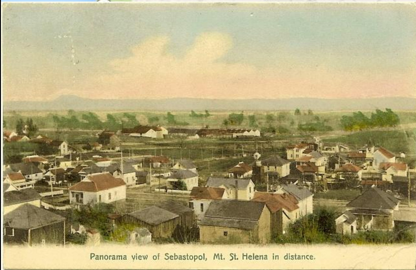
Panorama view of Sebastopol, Mt. St. Helena in distance.