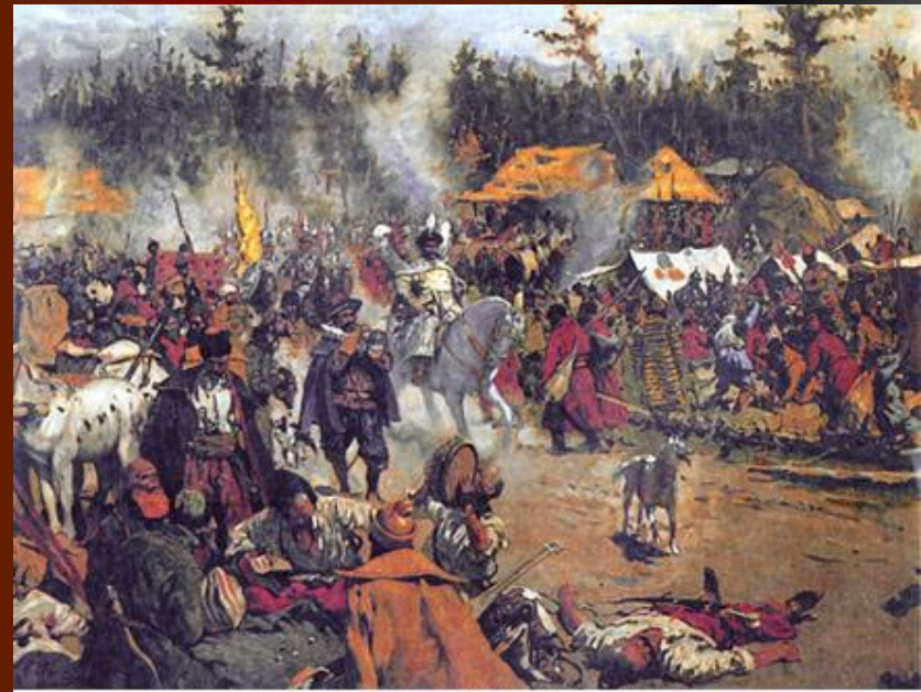
С.В. Иванов. "В смутное время"

"С осени 1606г. в государстве открылась кровавая смута, в которой приняли участия все сословиями московского общества, восстав одно на другое".