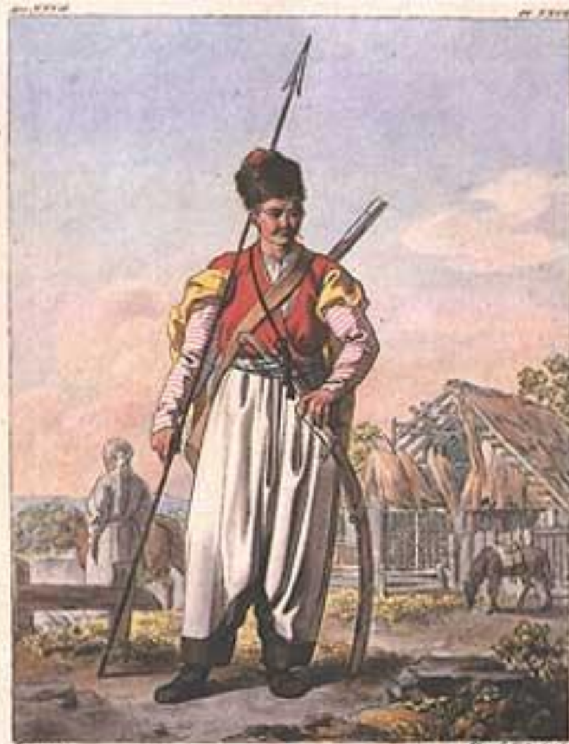
Уланъ изъ Кавказа. Уланъ de la Mer Noire.