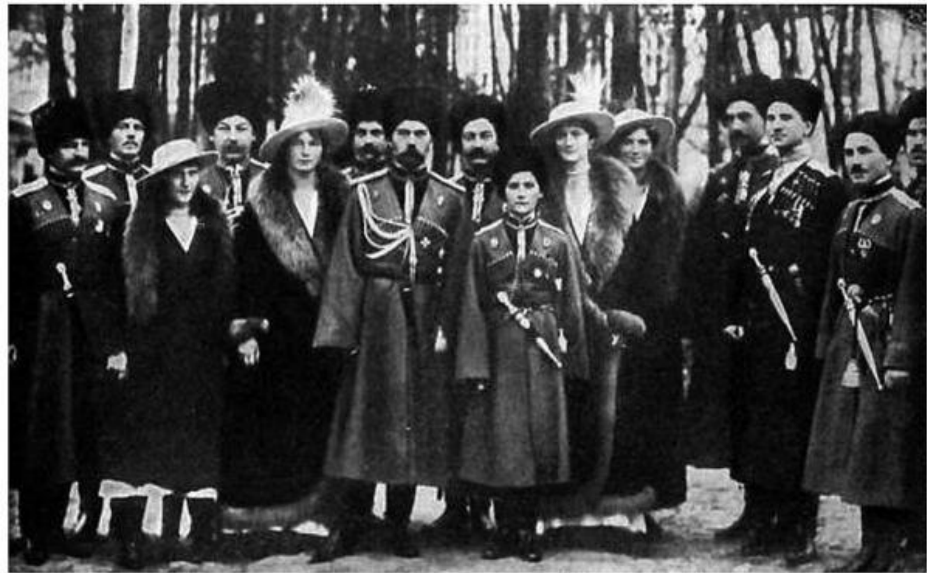
Николай II и цесаревич Алексей, в окружении офицеров Собственного Его Императорского Величества конвоя, ок. 1916 г.