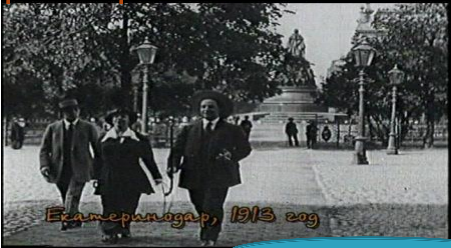
Екатеринбург, 1913 год