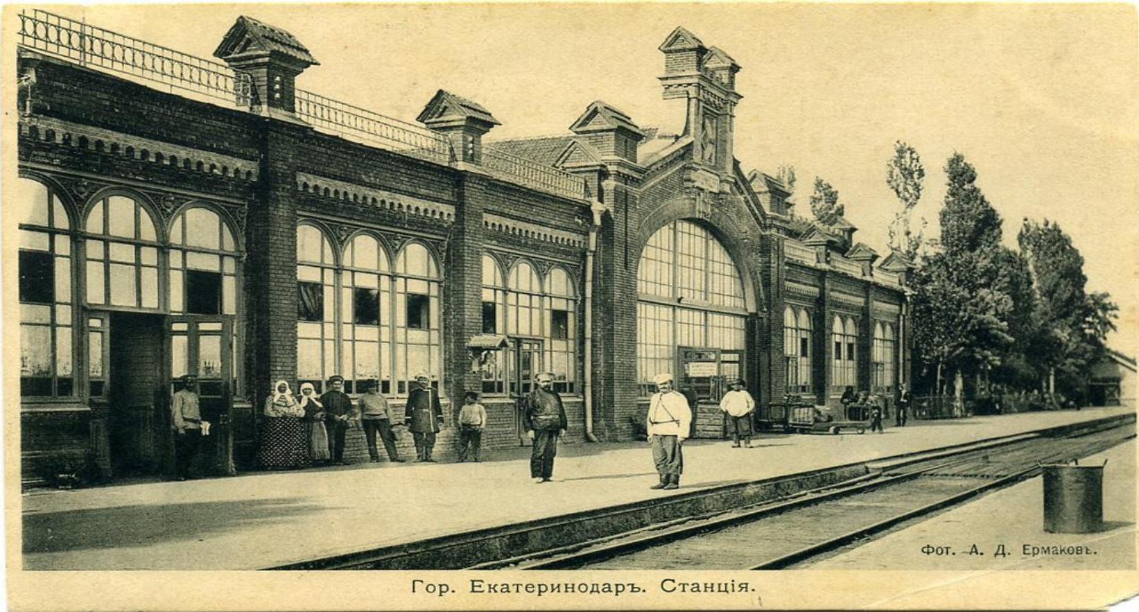
Гор. Екатеринодаръ. Станція.

Кубань и Черноморье занимали важное стратегическое положение не только на Северном Кавказе, но и на всем юго-востоке страны. По Кубани и Черноморскому побережью проходили главные пути сообщения, обеспечивавшие снабжение Кавказского фронта и связывавшие Закавказье с Россией. В конце ноября 1914 г. Николай II побывал на Кубани, совершая инспекторскую поездку по Кавказу.