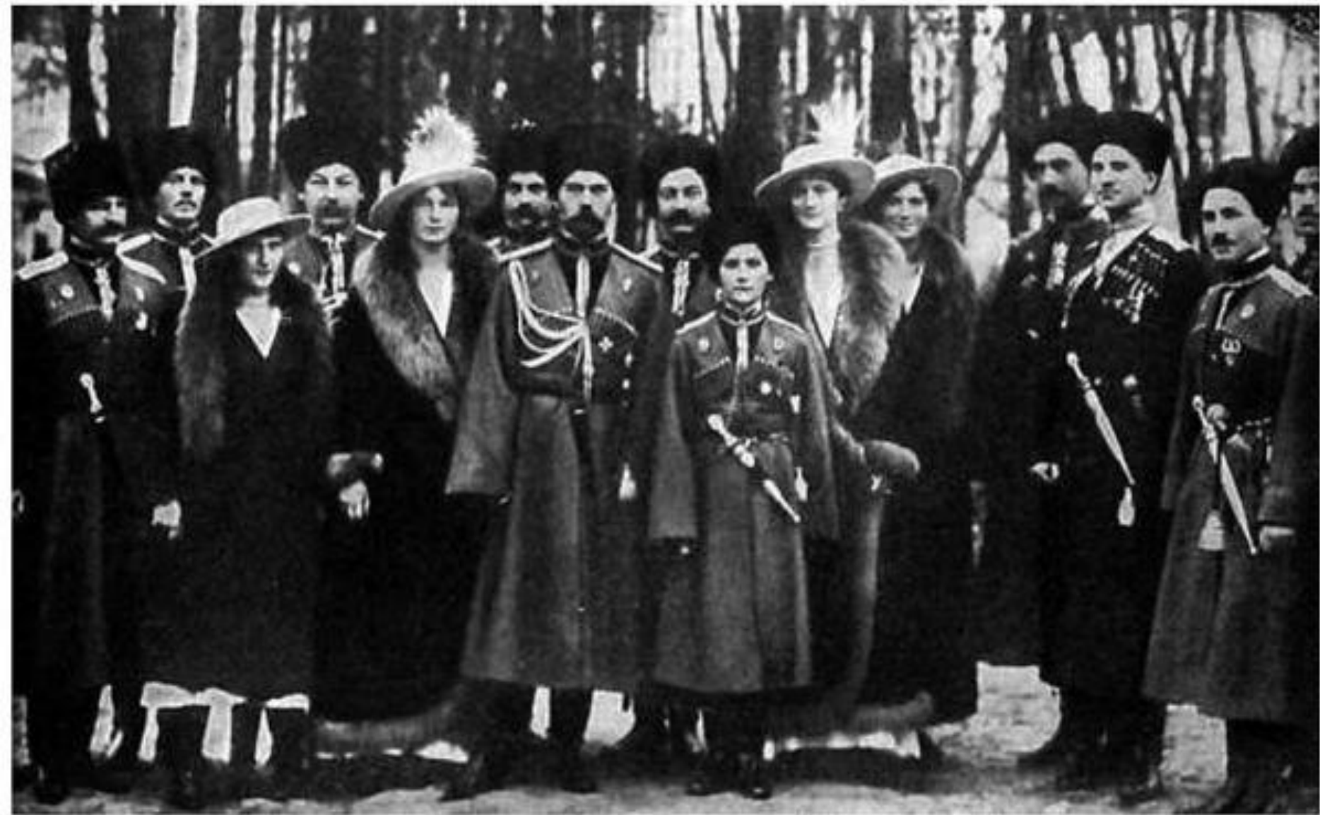
Николай II и цесаревич Алексей, в окружении офицеров Собственного Его Императорского Величества конвоя, ок. 1916 г.