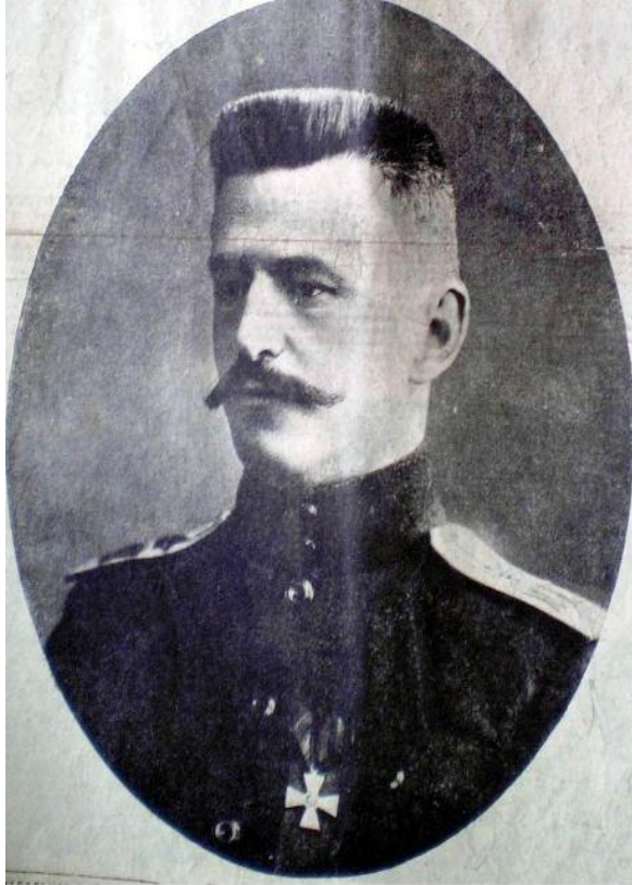
Подполковник В.М.Ткачев. 1917 г.

Уроженец станицы Келермесской летчик В.М Ткачев совершал до 130 вылетов в месяц. Его участие в воздушных боях Первой мировой войны было отмечено орденом Святого Георгия IV степени и Георгиевским оружием.