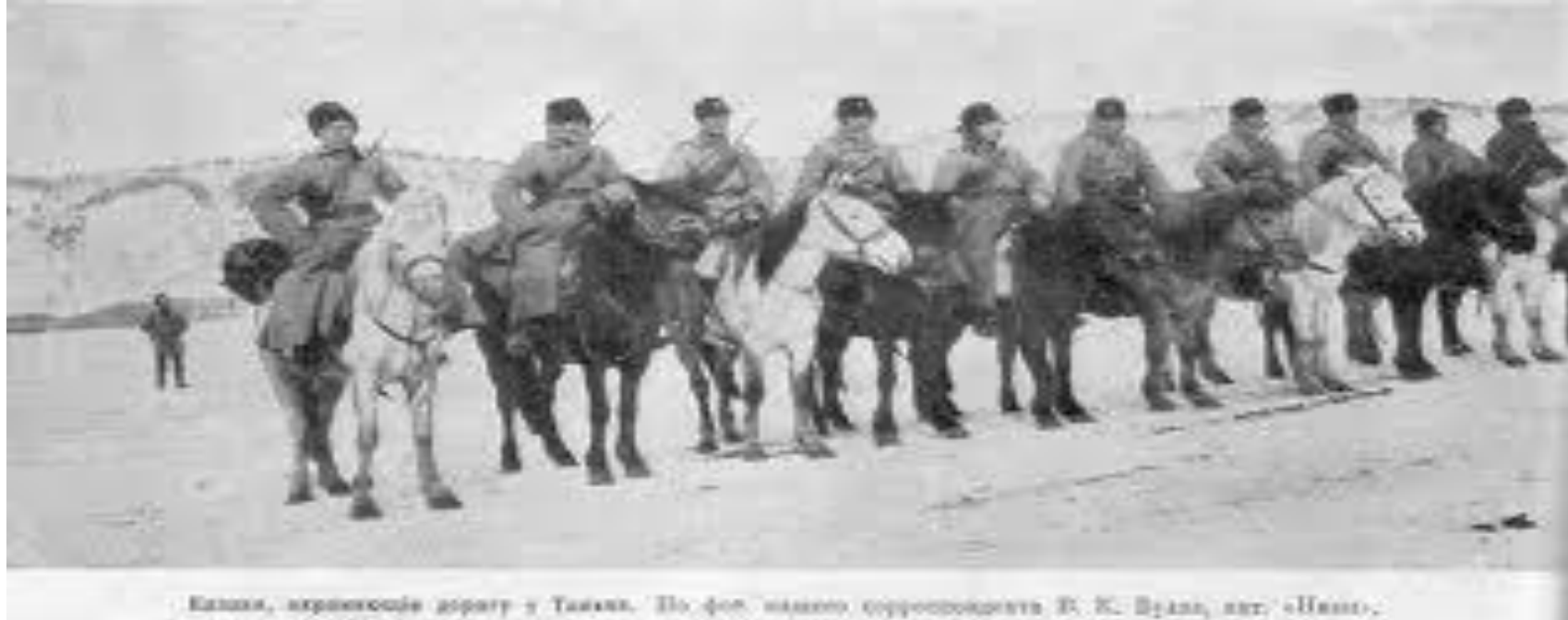
Кавказ, окрестности дороги в Ташкент.