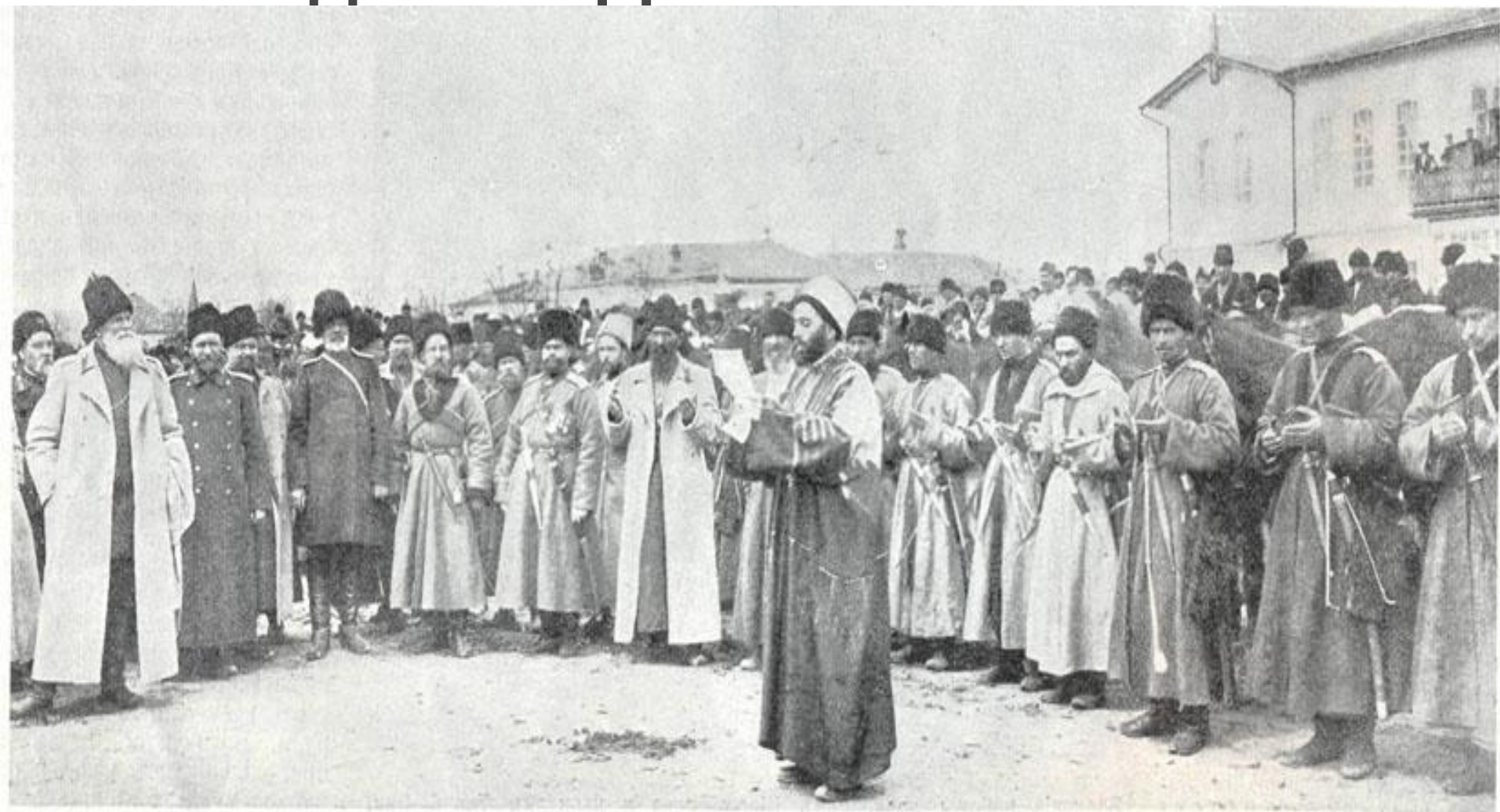
Терско-кубанский полк добровольцевъ въ Баталпашинскѣ (кубанской области) передъ отъездомъ на Дальній Востокъ. Молитва кадія.