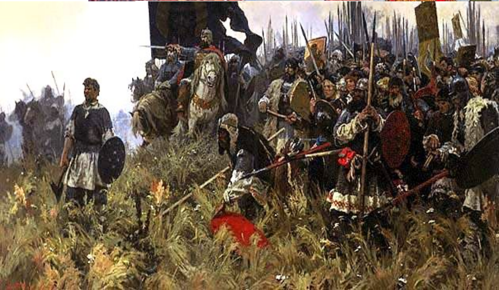
Бубнов Утро на Куликовом поле