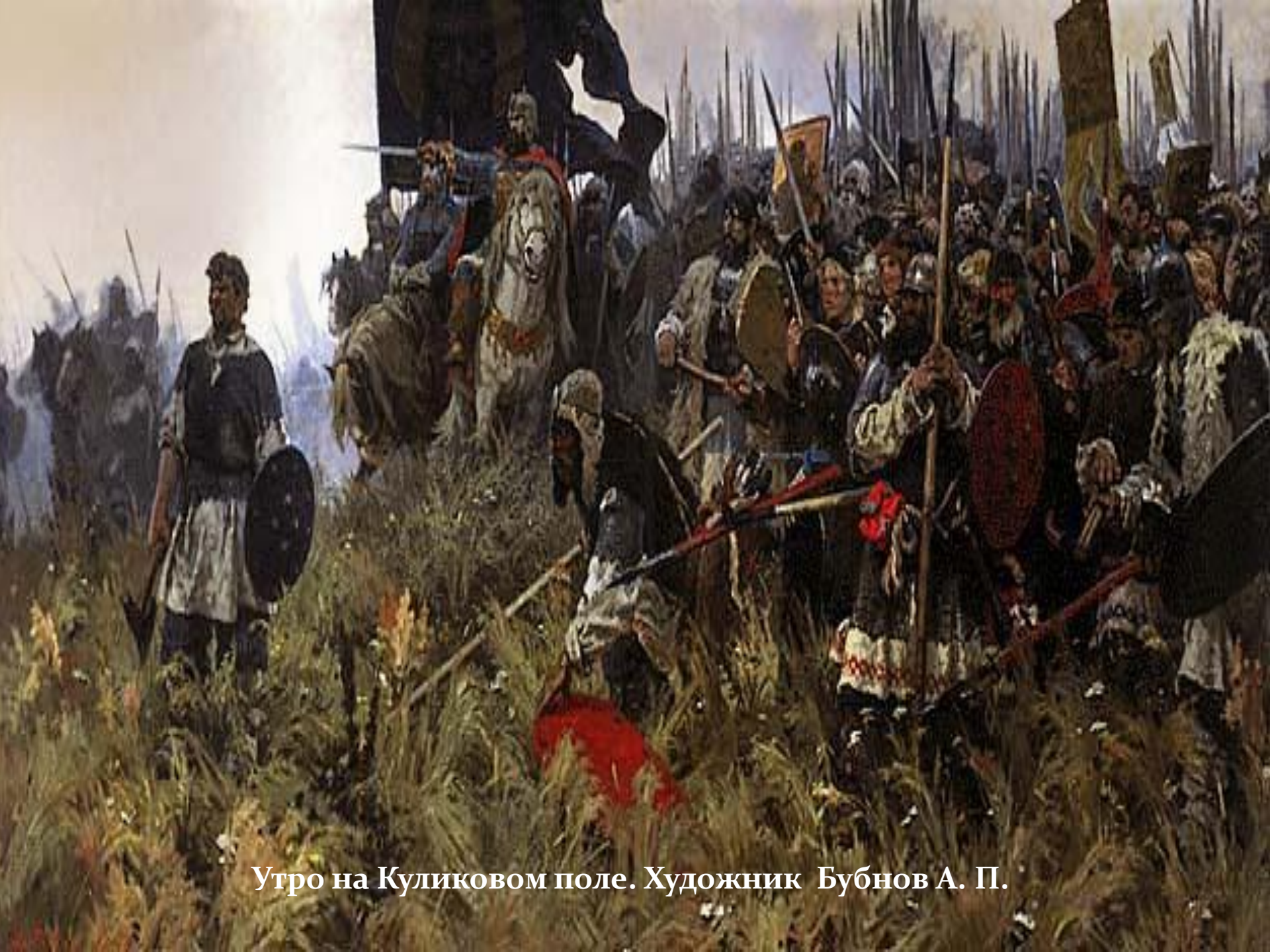
Утро на Куликовом поле. Художник Бубнов А. П.