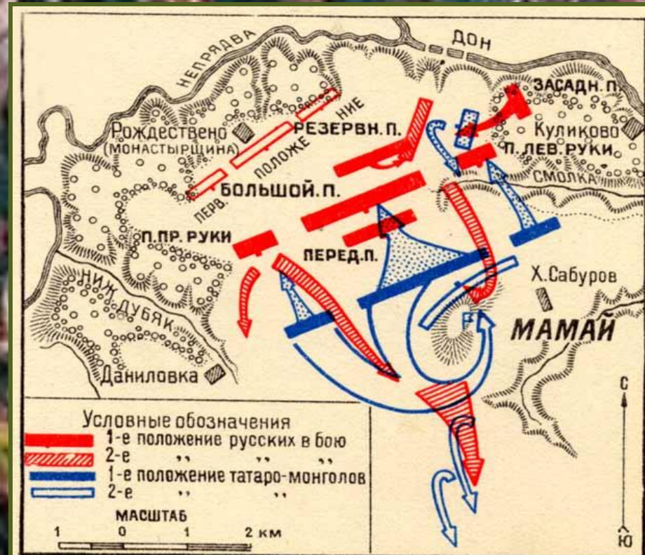
План Куликовской битвы