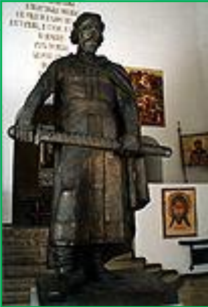
Памятник Д. Донскому