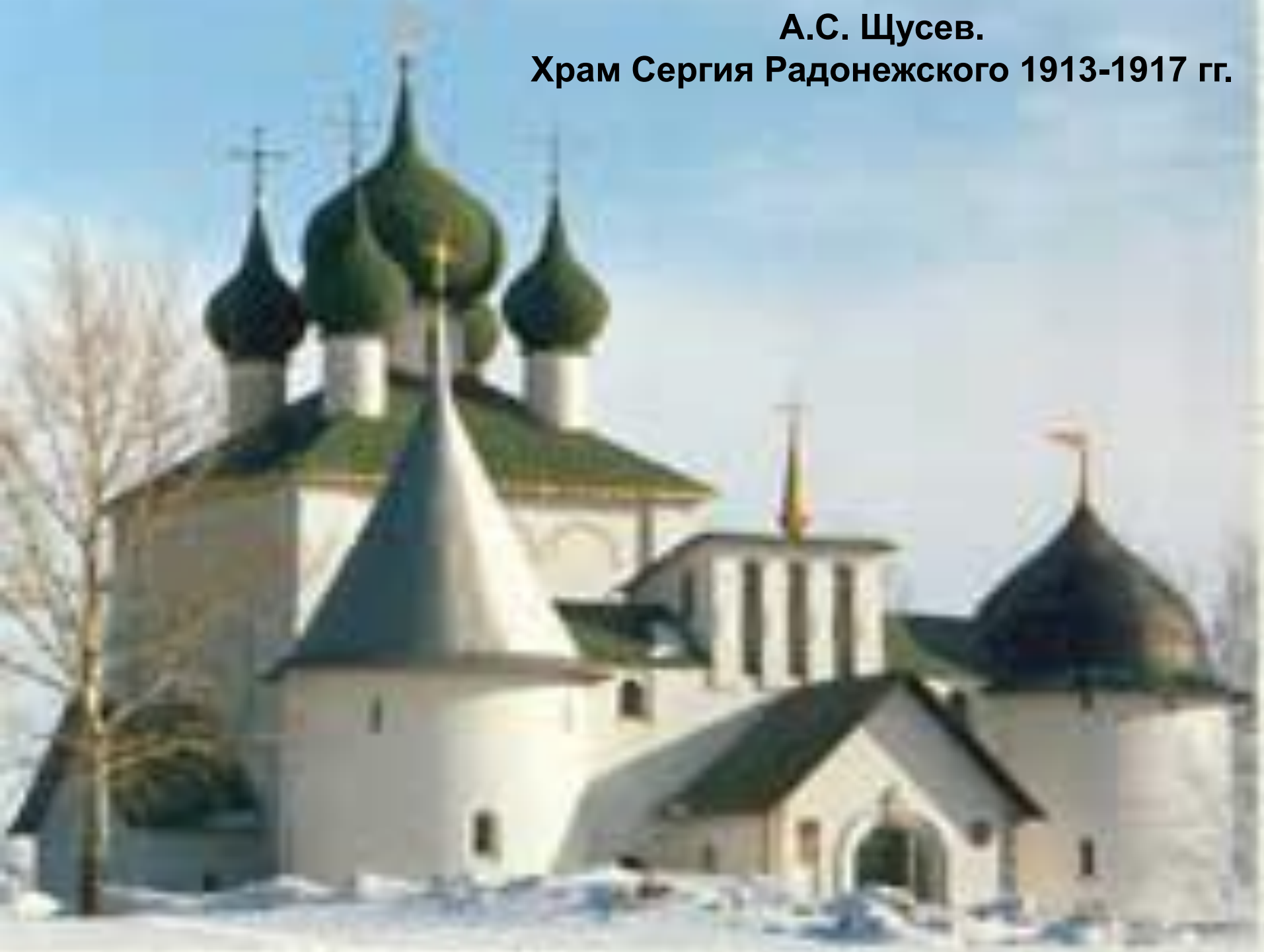
А.С. Щусев. Храм Сергия Радонежского 1913-1917 гг.