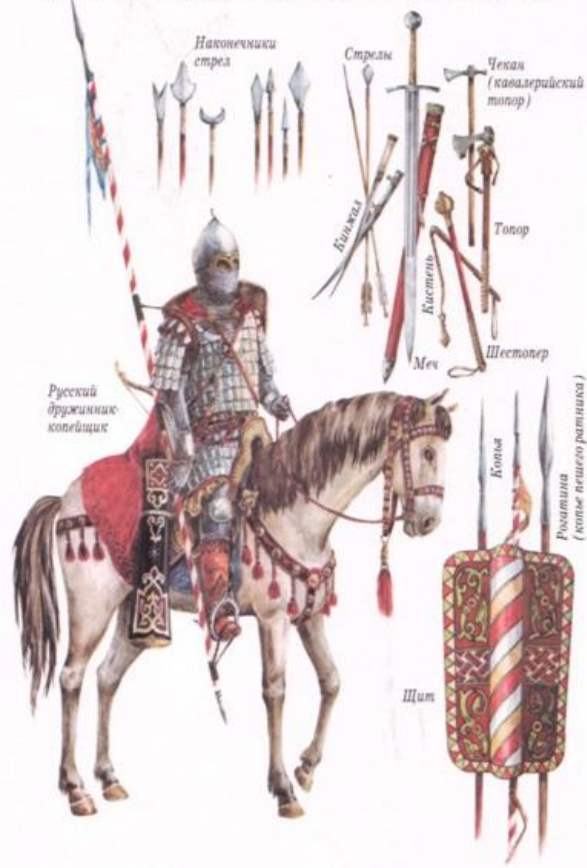
ВООРУЖЕНИЕ И ДОСПЕХИ РУССКИХ ВОИНОВ. XIV ВЕК