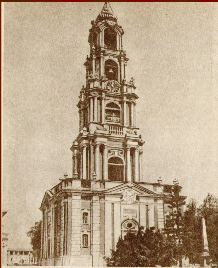
Колокольня Троице-Сергиевой лавры. Архитекторы И. Шумахер, И. Мичурин.