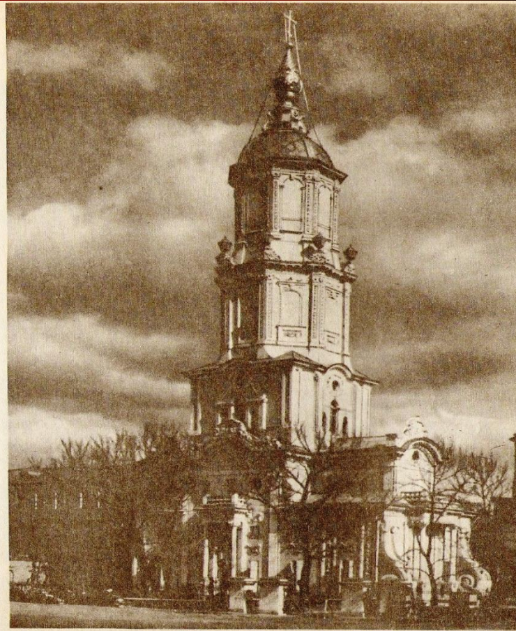
Минский собор (Англическая церковь) в Ухтомском. Архитекторы И. Шумахер, И. Мичурин.