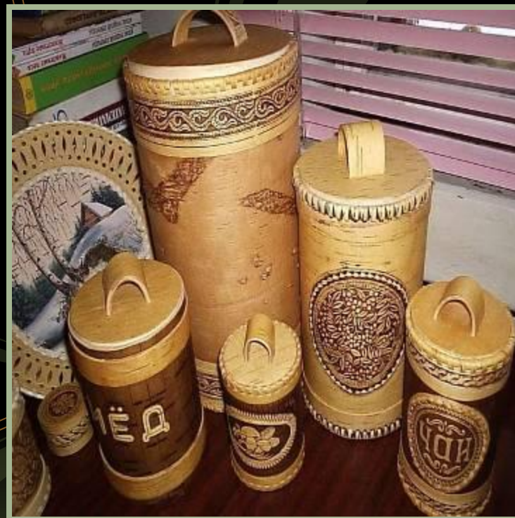
Береста и быт

Как правило, мастера заполняли поверхность изделий растительным орнаментом. Сквозное, ажурное «кружево» (резьбу) из бересты мастера накладывали обычно на яркий фон из ткани, фольги или бумаги.