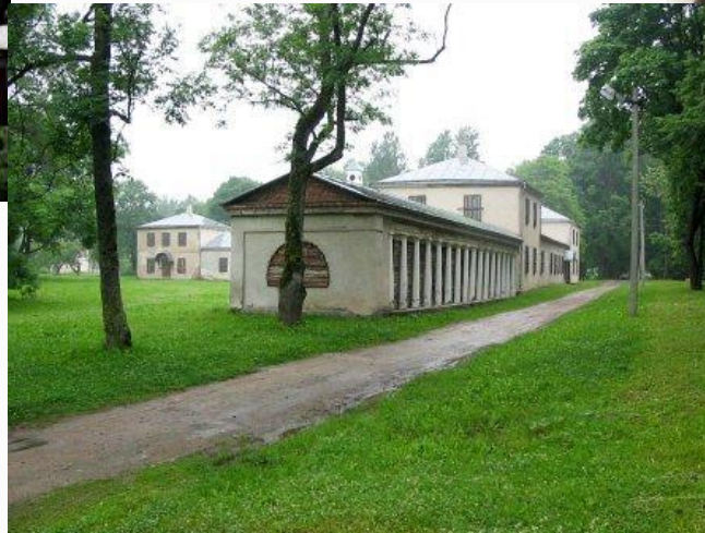
Михал Клеофас Огинский

«Северными Афинами» называли имение Залесье (нынешний Сморгонский район), принадлежавшее Михалу Клеофасу Огинскому. Он сочетал театральную деятельность с государственной, был активным участником восстания 1794 г. Направленного против раздела Речи Посполитой, стал автором знаменитого полонеза «Прощание с Родиной»