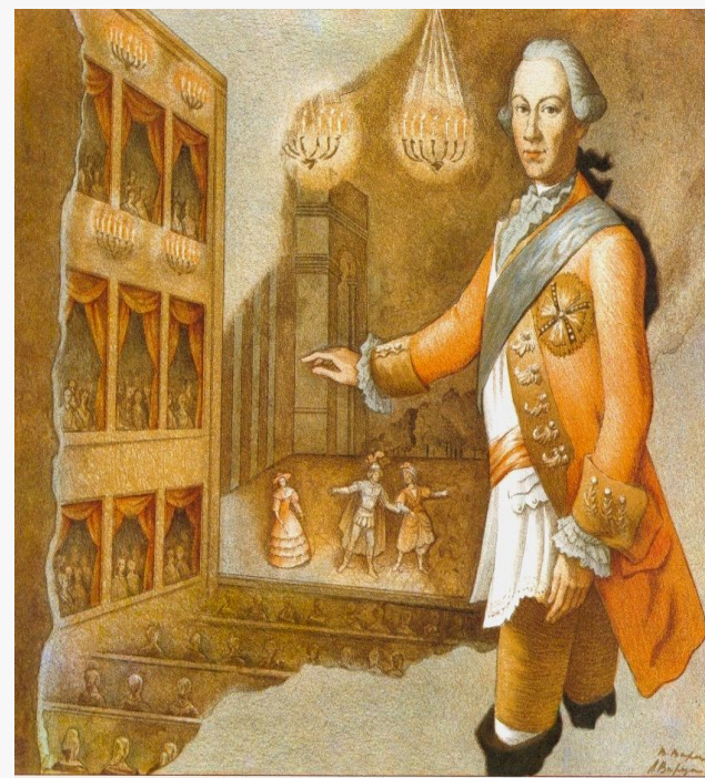
Міхаіл Агінскі (1730-1800)

Здесь давались грандиозные представления на сцене, размеры которой позволяли выезжать на нее на лошадях. Часть сцены занимал бассейн для водных представлений.