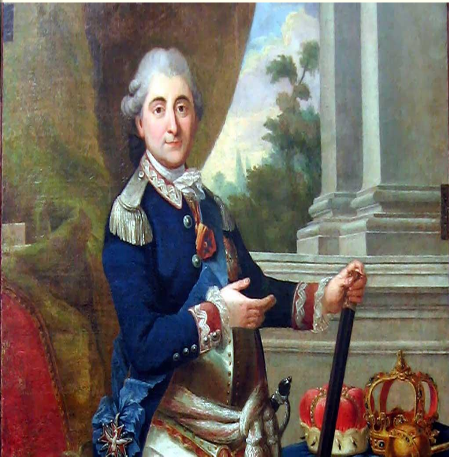
Станислав Август Понятовский