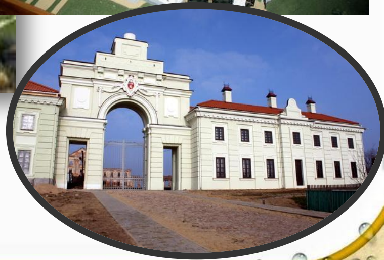
Дворец Сапегов в Ружанах