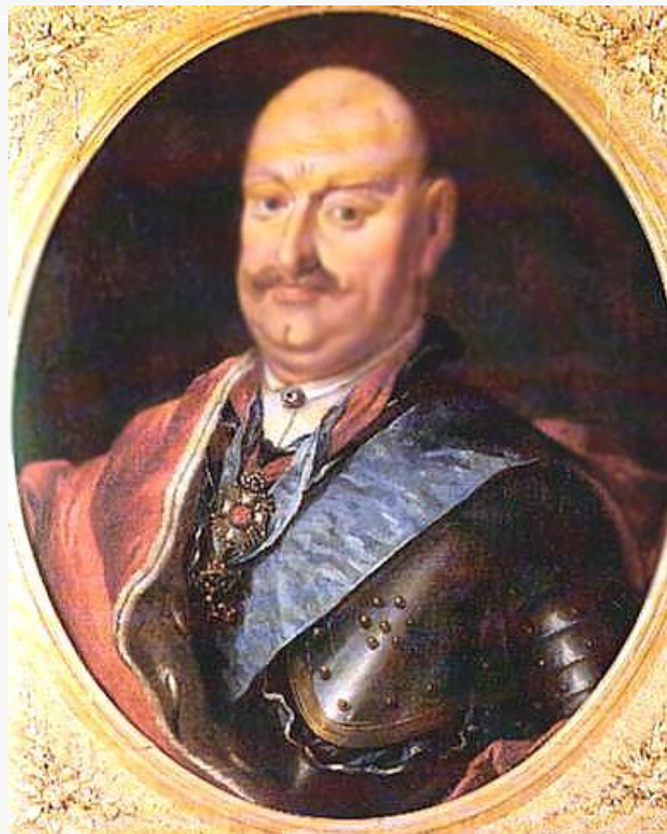
Кароль Станислав Радзивилл «Пане Коханка»

Кароль Станислав Радзивилл , известный своим прозвищем Пане Коханку.