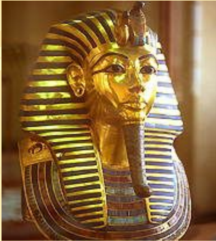
Золотая маска фараона Тутанхамона.

В Древнем Египте власть принадлежала фараонам. Тутанхамон, умерший совсем молодым, стал самым известным древнеегипетским правителем благодаря тому обстоятельству, что его гробница, единственная среди погребений древнеегипетских фараонов, осталась неразграбленной, и ее богатейшая погребальная обстановка дошла до нас почти полностью, став одной из крупнейших археологических сенсаций 20 в.