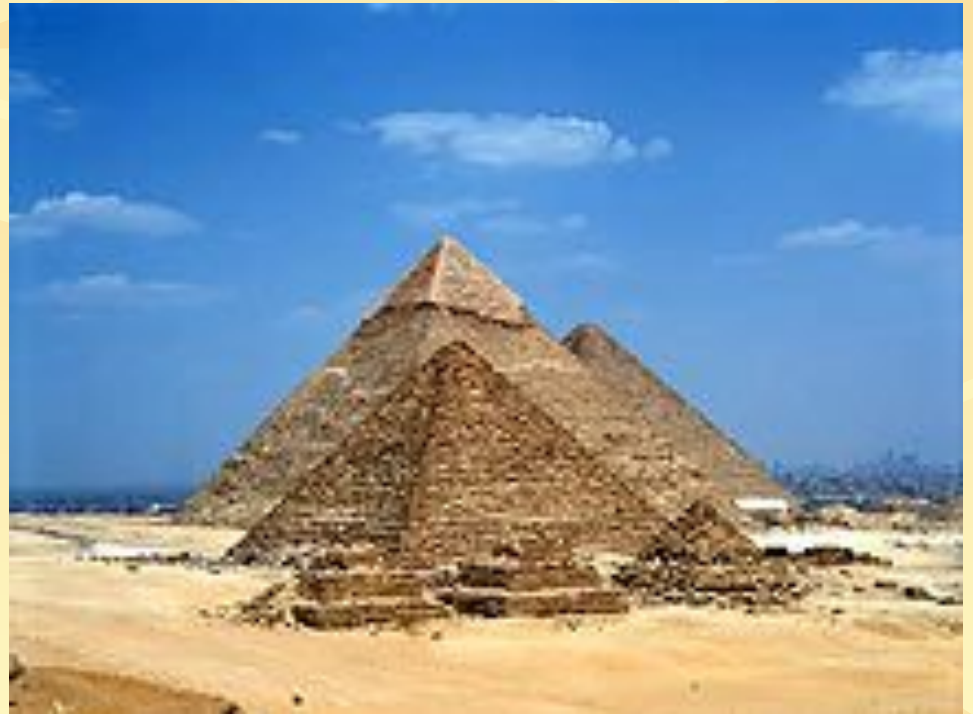
Пирамиды Хеопса, Хефрена и Микерина. Эль-Гиза. 27 в. до н. э.

Пирамида - это монументальное сооружение, имеющее геометрическую форму пирамиды (иногда также ступенчатую или башнеобразную). Пирамидами называют гигантские гробницы древнеегипетских фараонов 3-2-го тыс. до н. э., например, Египетские пирамиды в Эль-Гизе.