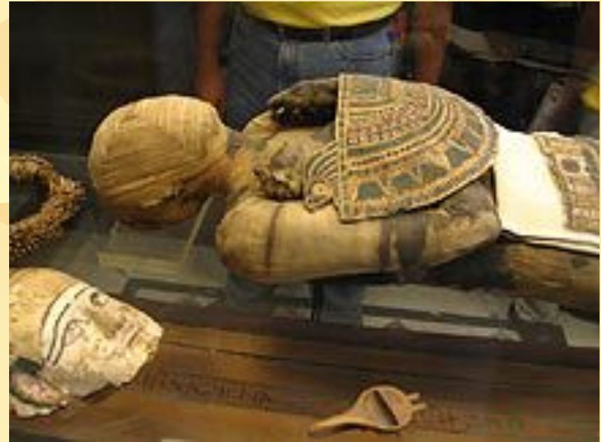
Древнеегипетская мумия. Лувр.

Практика мумификации тел умерших существовала на протяжении всей древнеегипетской истории и была одной из главных особенностей египетской культуры. Сохранение тела являлось необходимым требованием воскресения в загробном мире и обретения вечной жизни. Готовая мумия обертывалась льняными бинтами, между которыми помещались многочисленные амулеты, предназначенные оберегать умершего от враждебных демонов преисподней. Украшенную портретной маской мумию укладывали в деревянный расписной гроб (или несколько гробов), а затем в массивный каменный саркофаг. Пышность погребения и количество погребальной утвари варьировалось в зависимости от социального и имущественного положения покойного.