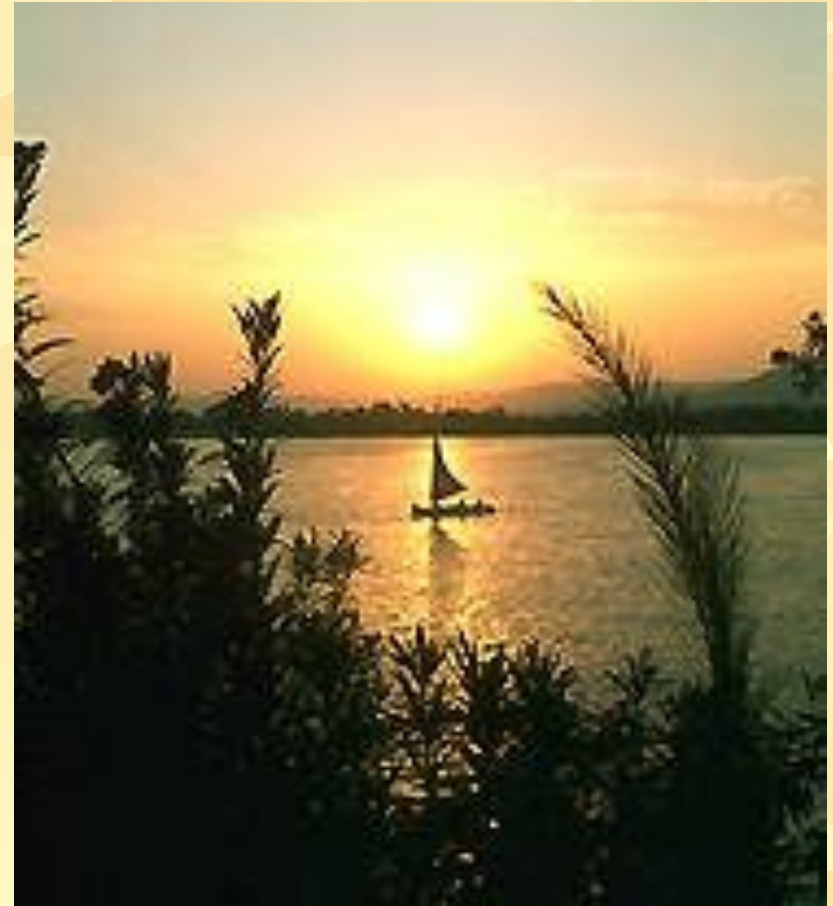
Закат на Ниле