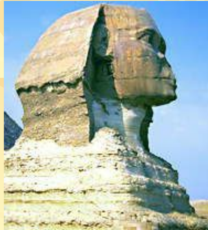
Сфинкс фараона Хефрена и пирамиды. Гиза