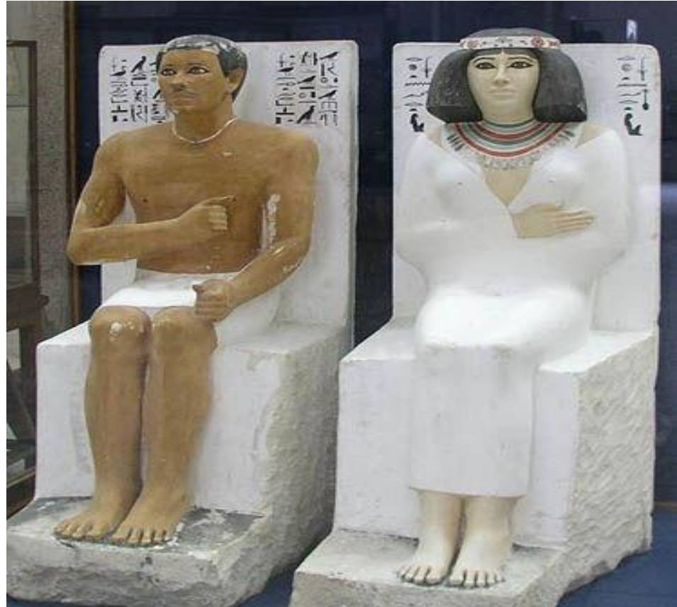
Вельможа Рахотеп и его жена Неферт

В гробницах ставили каменную или деревянную статую умершего, в точности воспроизводящую его облик.