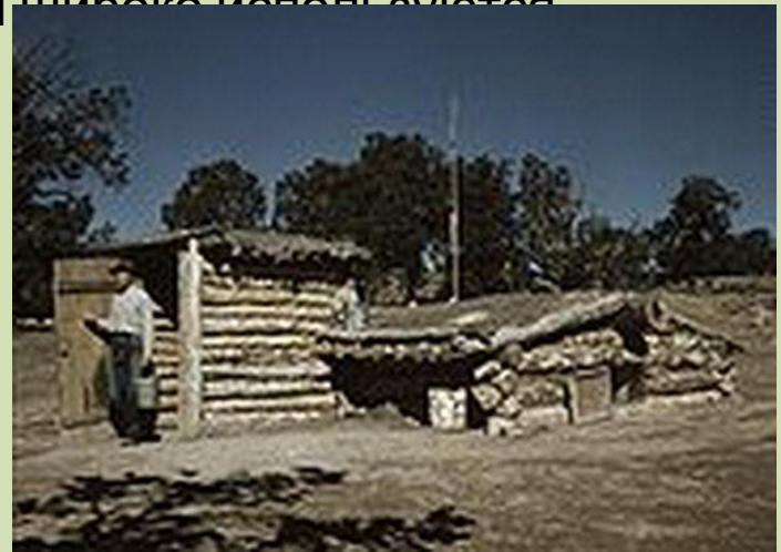
Землянки- первые жилища простых кимтайцев