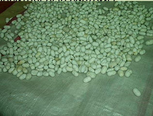
Коконсы тутового шелкопряда

В середине I тыс. до н. э. Китай переживает бурный социально-экономический рост. Складываются новые центры торговли, численность населения многих городов приближается к полумиллиону. Высокого уровня достигают плавка железа. Успешно развиваются ремесла, строятся гидротехнические сооружения. В земледелии широко используются оросительные системы.