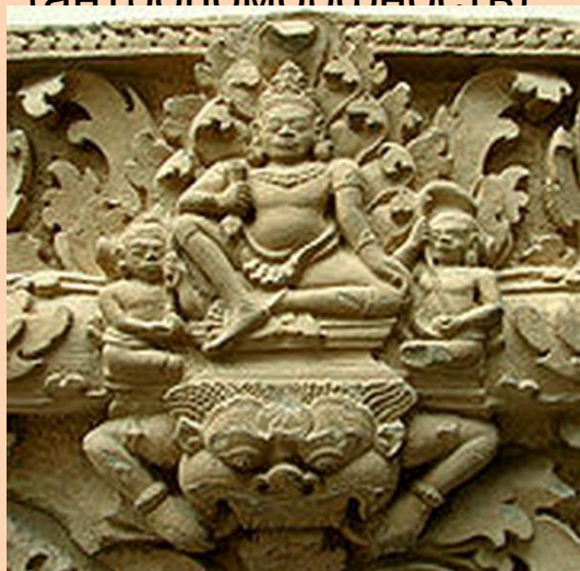
Индра- бог грозы, воитель

Первая религия Индии - ведизм — религия Вед. Для него характерно многобожие и наделение человеческими качествами животных, предметов (антропоморфность)