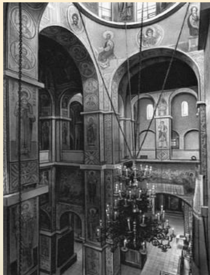
Софийский собор в Новгороде

По примеру Киева в 40-е — 50-е годы XI века были построены Софийские соборы в Новгороде и Полоцке. Дошедшая до нашего времени София Новгородская намного строже и монументальнее киевского собора — гармоничная византийская традиция ощущается здесь намного слабее. Новгородская архитектура, в отличие от киевской, не знает мозаики — Софию Новгородскую украшали только фрески.