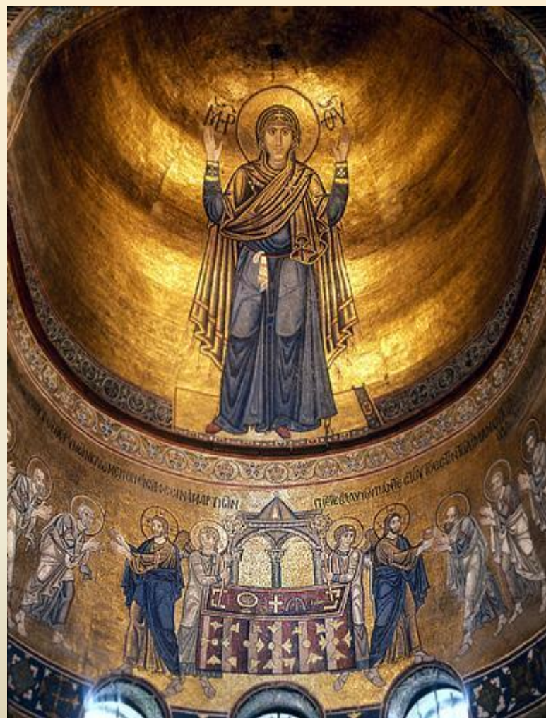
Богоматерь Оранта. Мозайка.

Софийский собор в Киеве украшают удивительные мозайки, самой знаменитой из которых является изображение Богоматери Оранты.