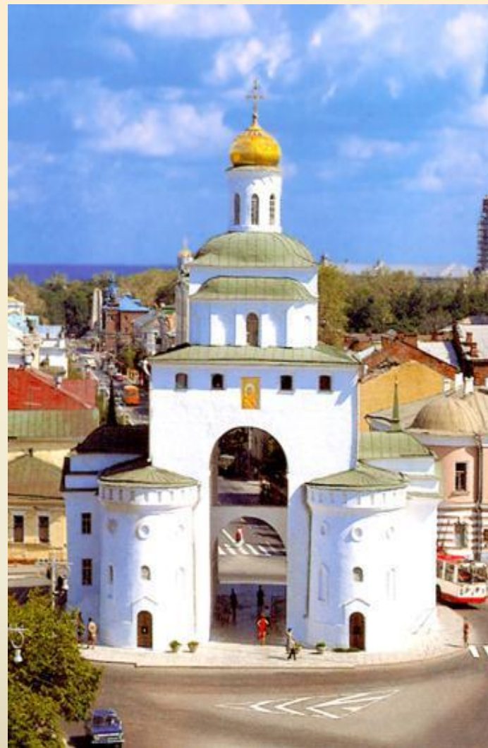
Золотые ворота в Киеве

Нам известны древнерусские произведения не только церковной, но и светской архитектуры. Судя по летописным известиям, каменные палаты строились для князей еще в языческую эпоху — археологические раскопки подтверждают эти сведения. Однако до нас дошли постройки уже XI века — прежде всего это Золотые ворота в Киеве.