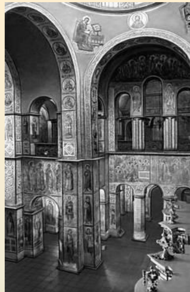
Софийский собор в Киеве, 1037г.