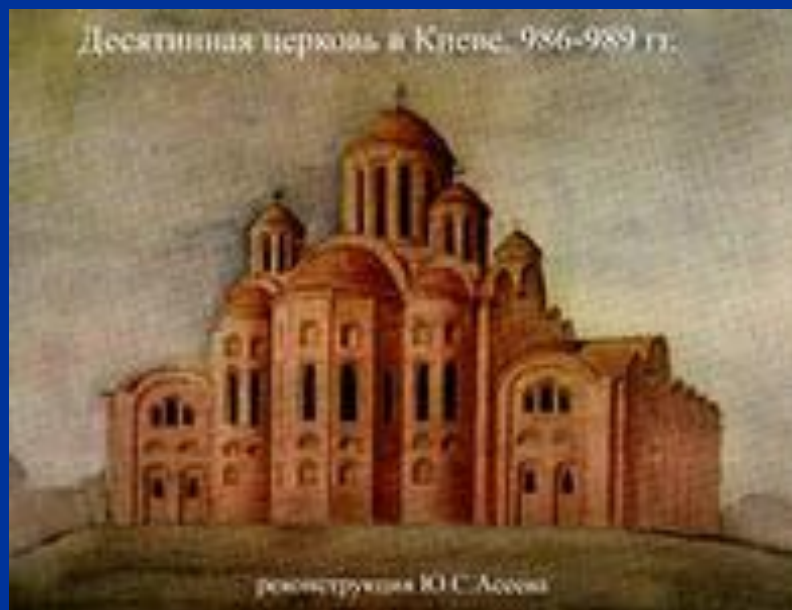
реконструкция Ю.С. Асеева