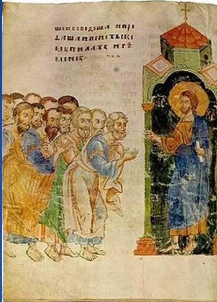
Отослание апостолов на проповедь. Миниатюра из Сийского Евангелия 1339 г. – древнейшей московской рукописи.