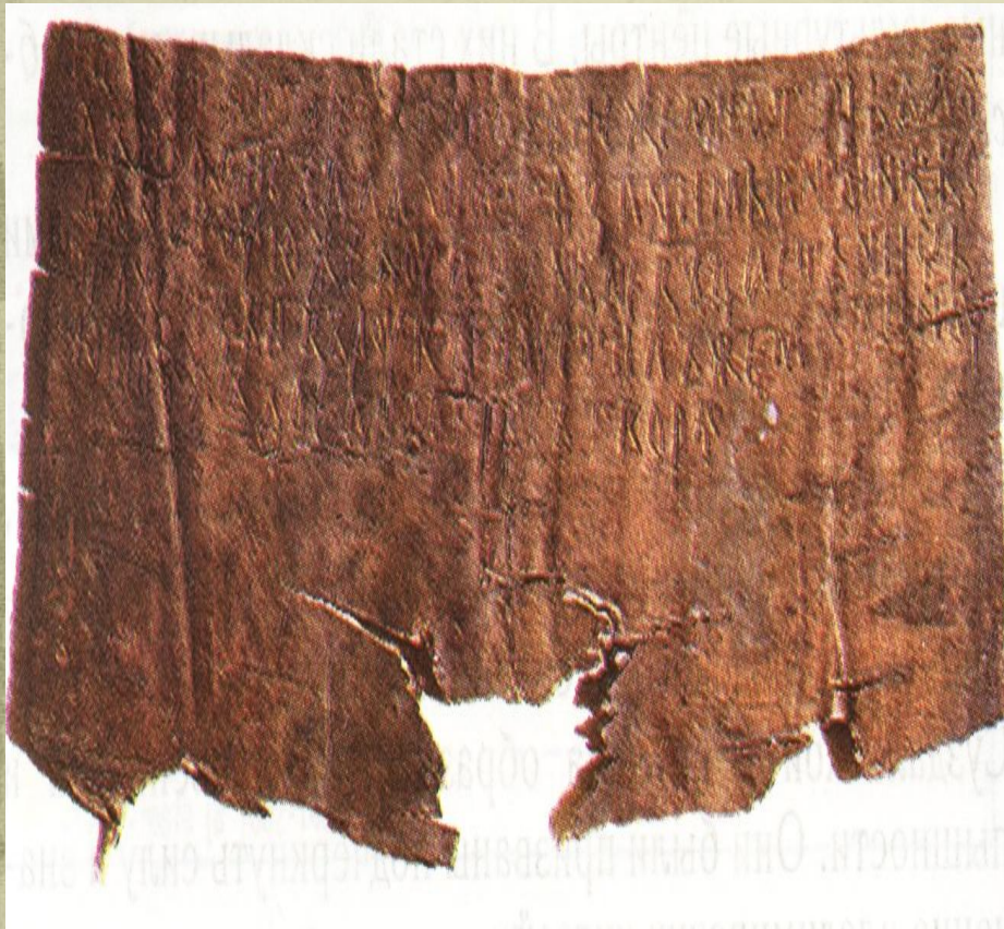
Новгородская берестяная грамота