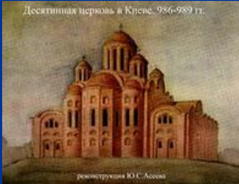
реконструкция Ю.С. Асеева