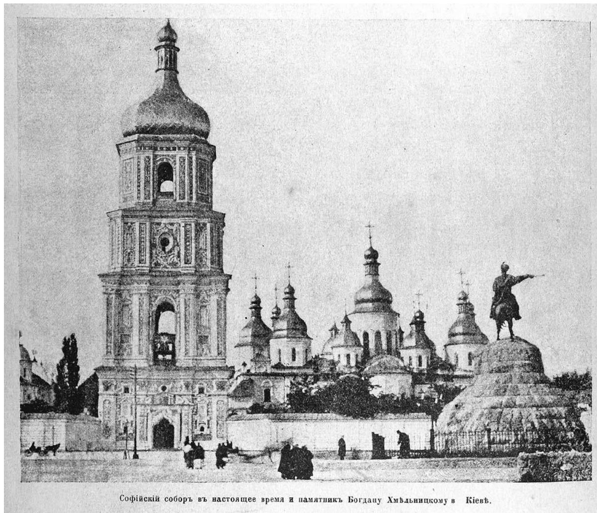
Софійскій соборъ въ настоящее время и памятникъ Богдану Хмельницкому в Кіевѣ.