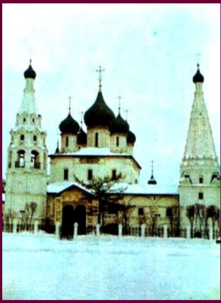
Церковь Ильи Пророка В Ярославле

В архитектуре 17 в.наблюдается отход от строгих церковных правил-в частности появляется т.н.