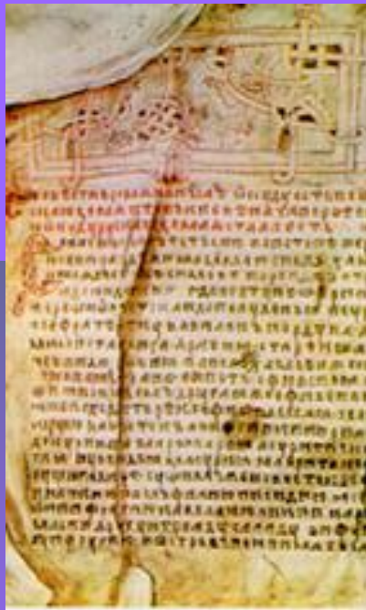
Повесть временных лет