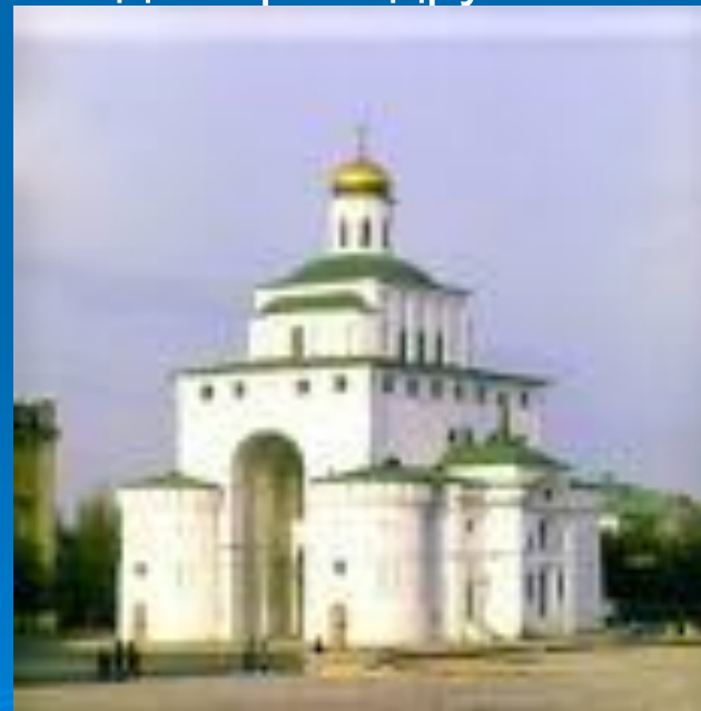
Золотые ворота во Владимире