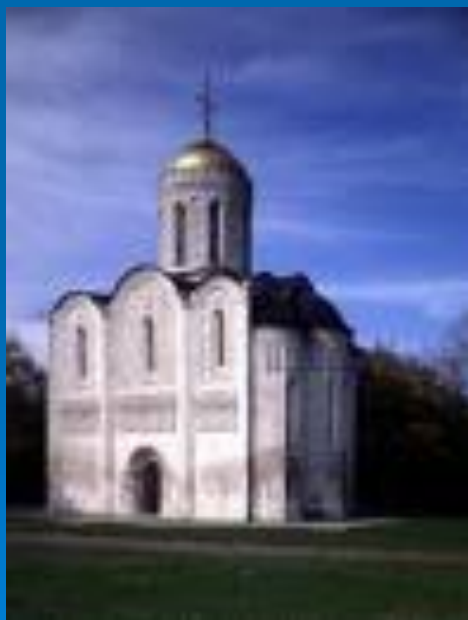
Дмитриевский собор во Владимире