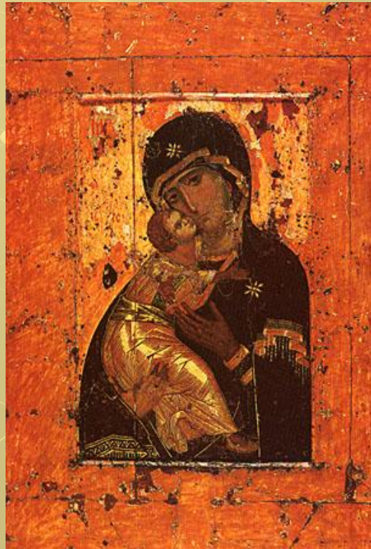
Владимирская икона Божией Матери