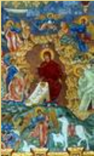
Фрагмент фрески в церкви Ильи Пророка в Ярославле