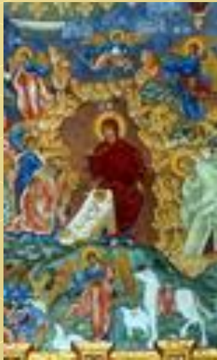
Фрагмент фрески в церкви Ильи Пророка в Ярославле