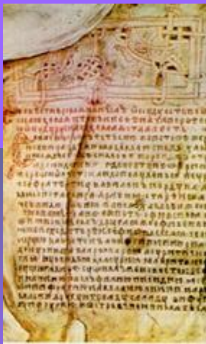
Повесть временных лет