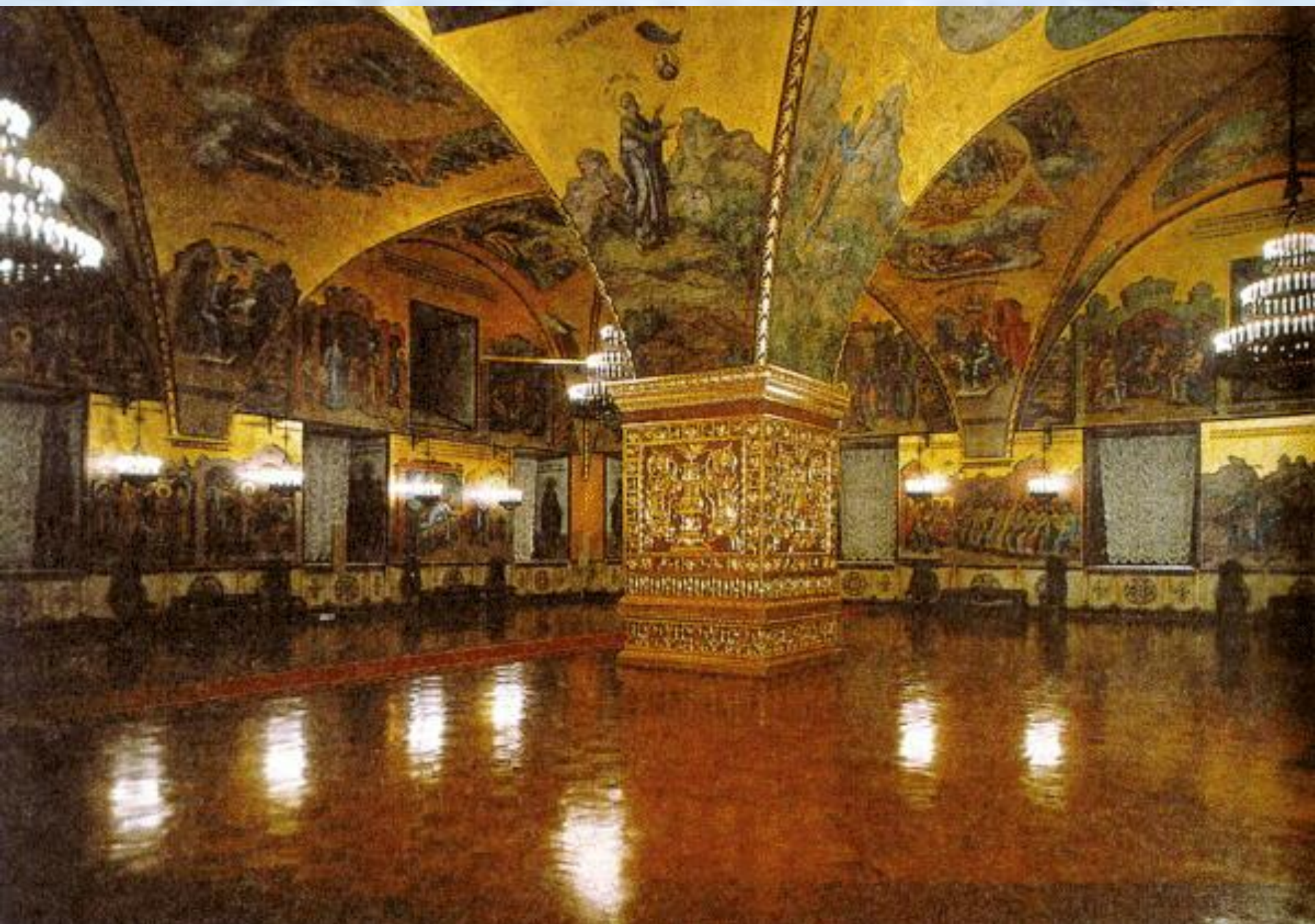
Симон Федорович Ушаков (Пимен), русский живописец и гравер.