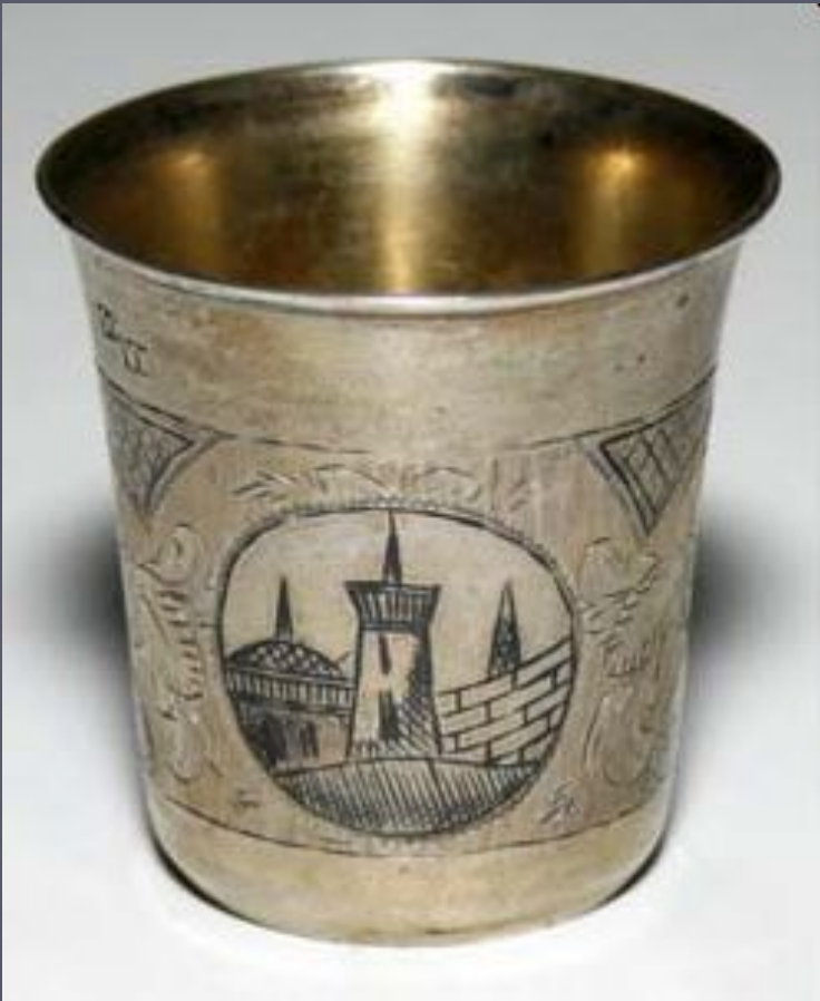
Рисунок наносится острым грабштихелем на гладкий предмет. Чтобы сделать изображение более четким, в выгравированные места втирается черная краска. Так возникает «чернь». В конце XVIII века для гравировки стали применять машины — эта техника стала называться гильоширование, а с начала XIX века была перенесена из токарной обработки дерева и полностью вытеснила кустарное художественное гравирование.