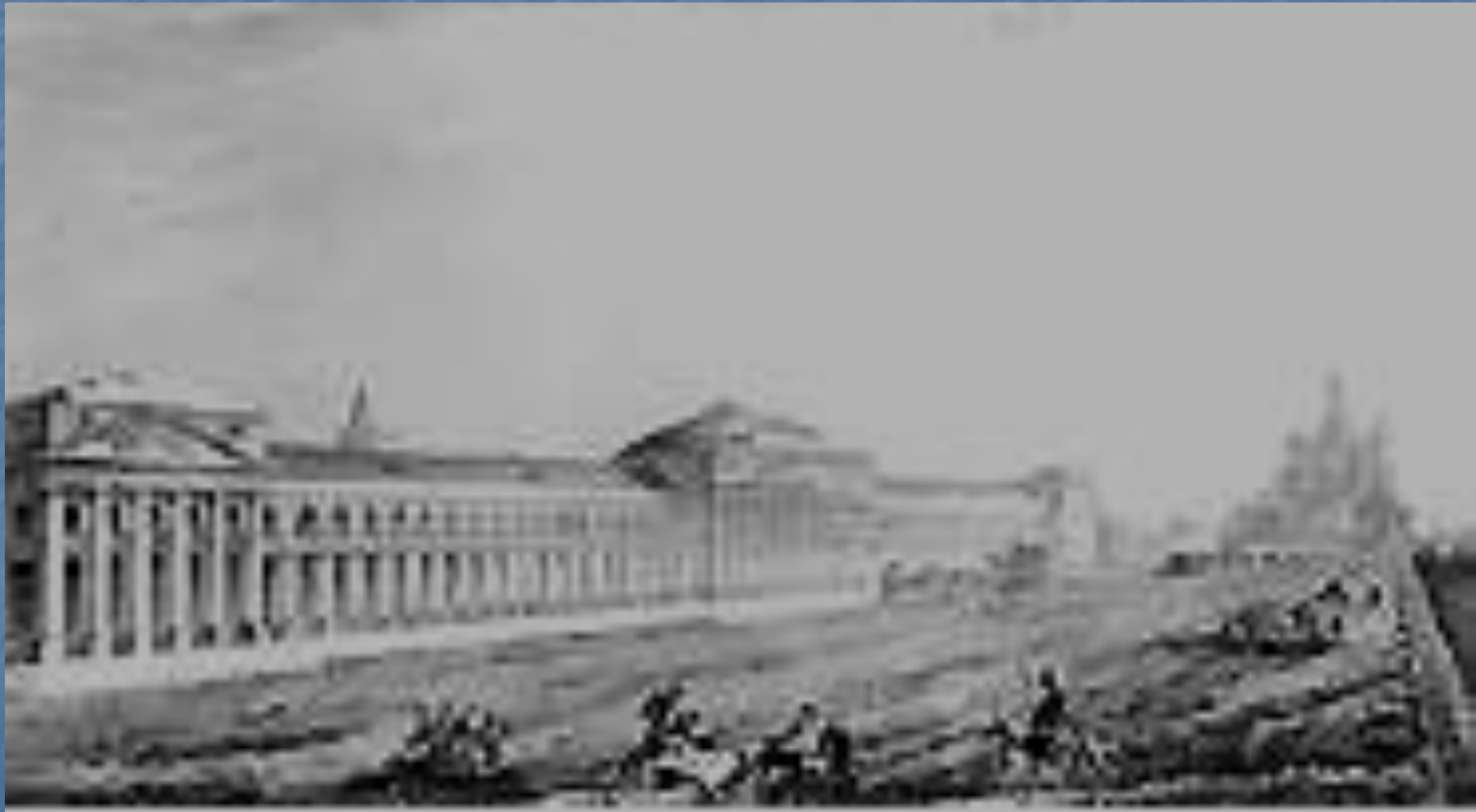
Осип Бове. Красная площадь, реконструированная после пожара 1812 г.