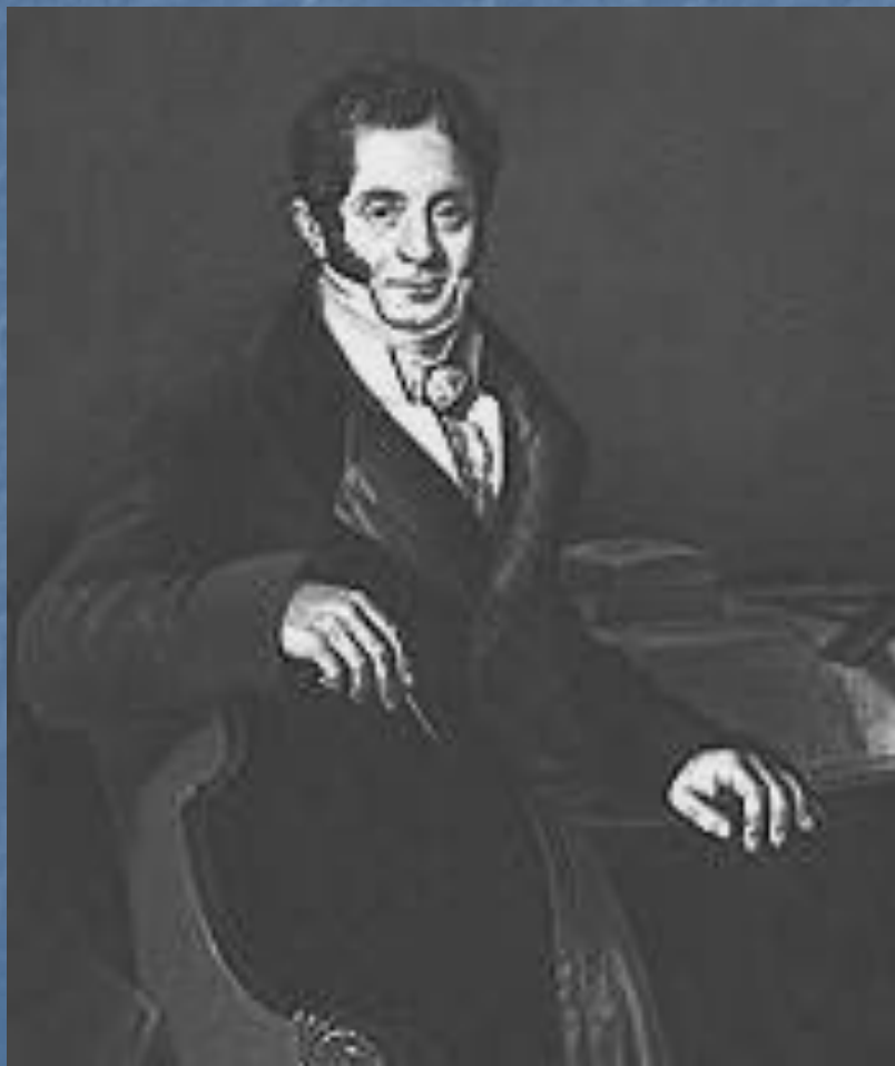
Карл Иванович Росси