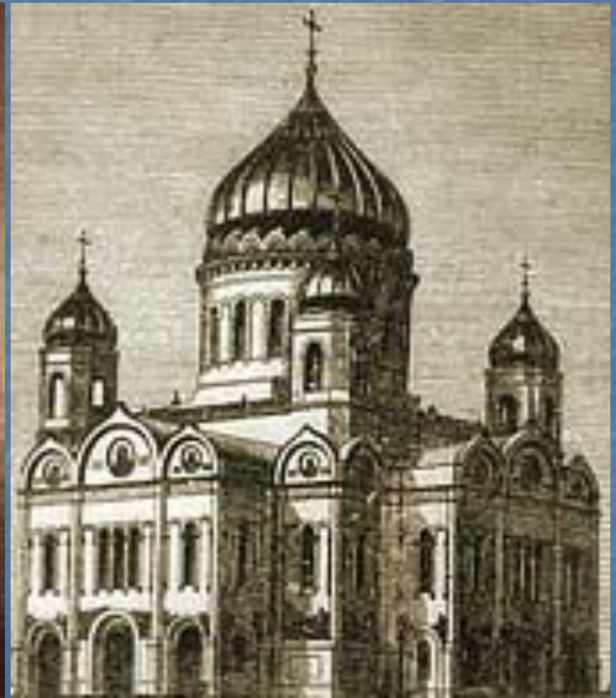
Константин Андреевич Тон Храм Христа Спасителя