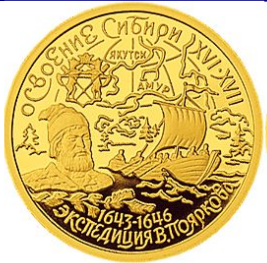
Памятная монета в честь Освоения Сибири