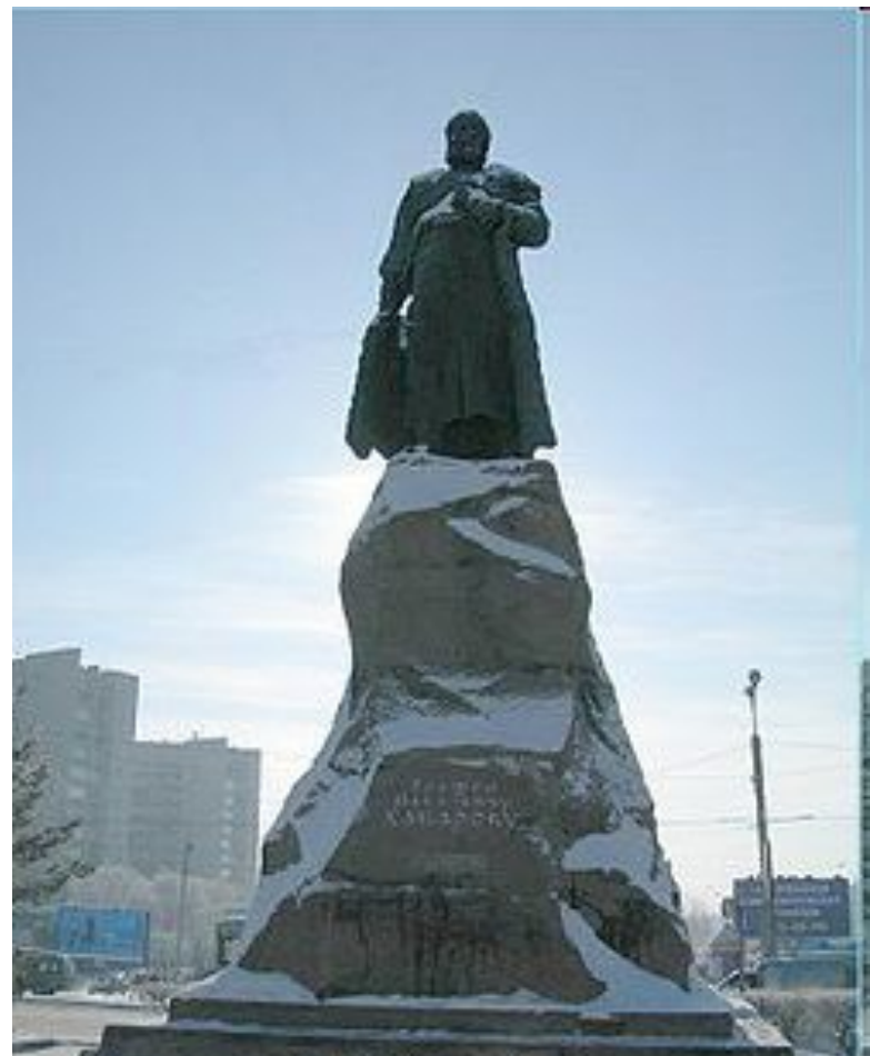
Памятник Е.П. Хабарову