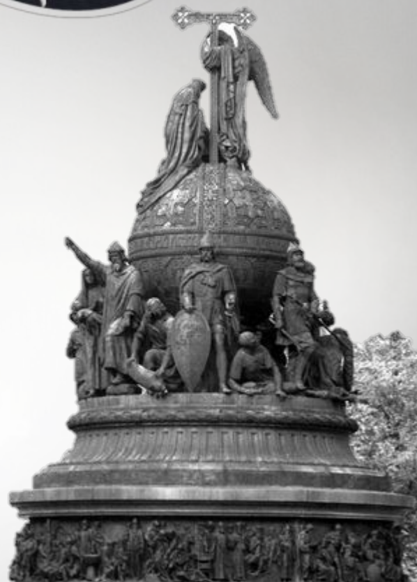
«Памятник тысячелетие России» М.О.Микешин