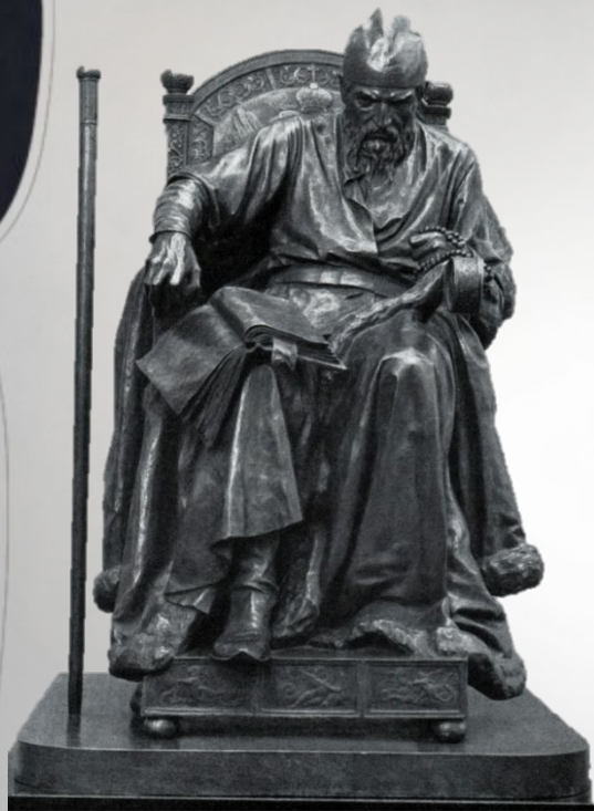
«Иван Грозный» М.М. Антокольский