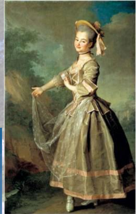
Д.Левицкий «Портрет воспитанницы Смольного Института»