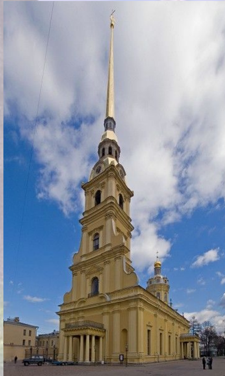
Д.Трезини Петропавловский собор (петровское барокко)