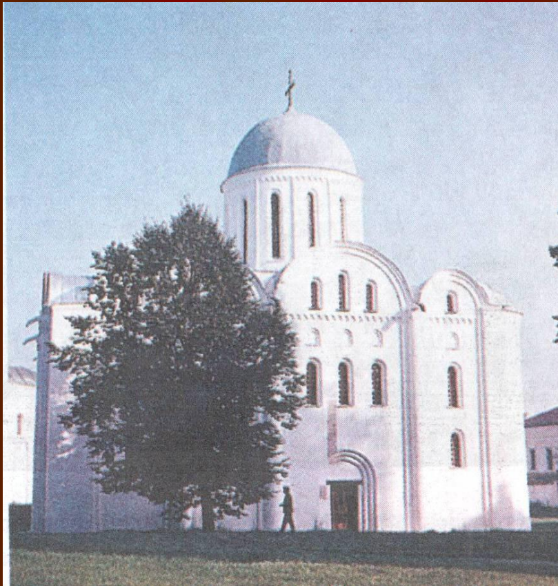
Дмитровский собор во Владимире.