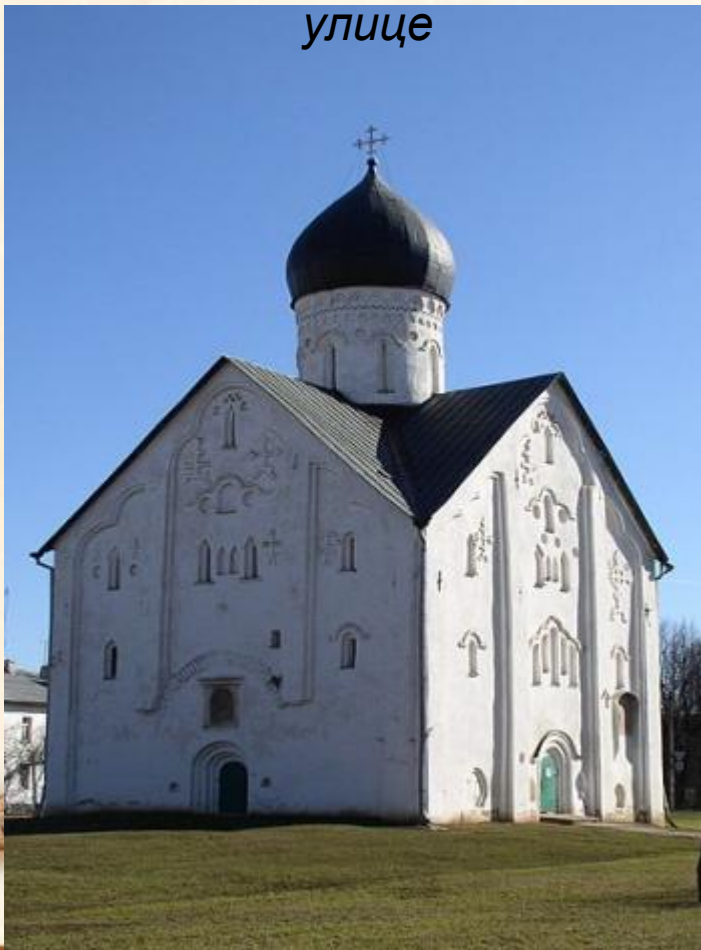
Церковь Спаса Преображения на Ильине улице