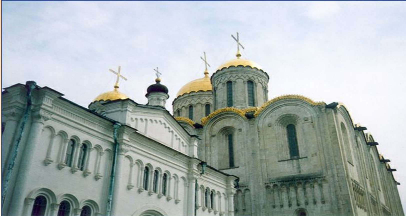
Владимир. Купола Успенского собора.