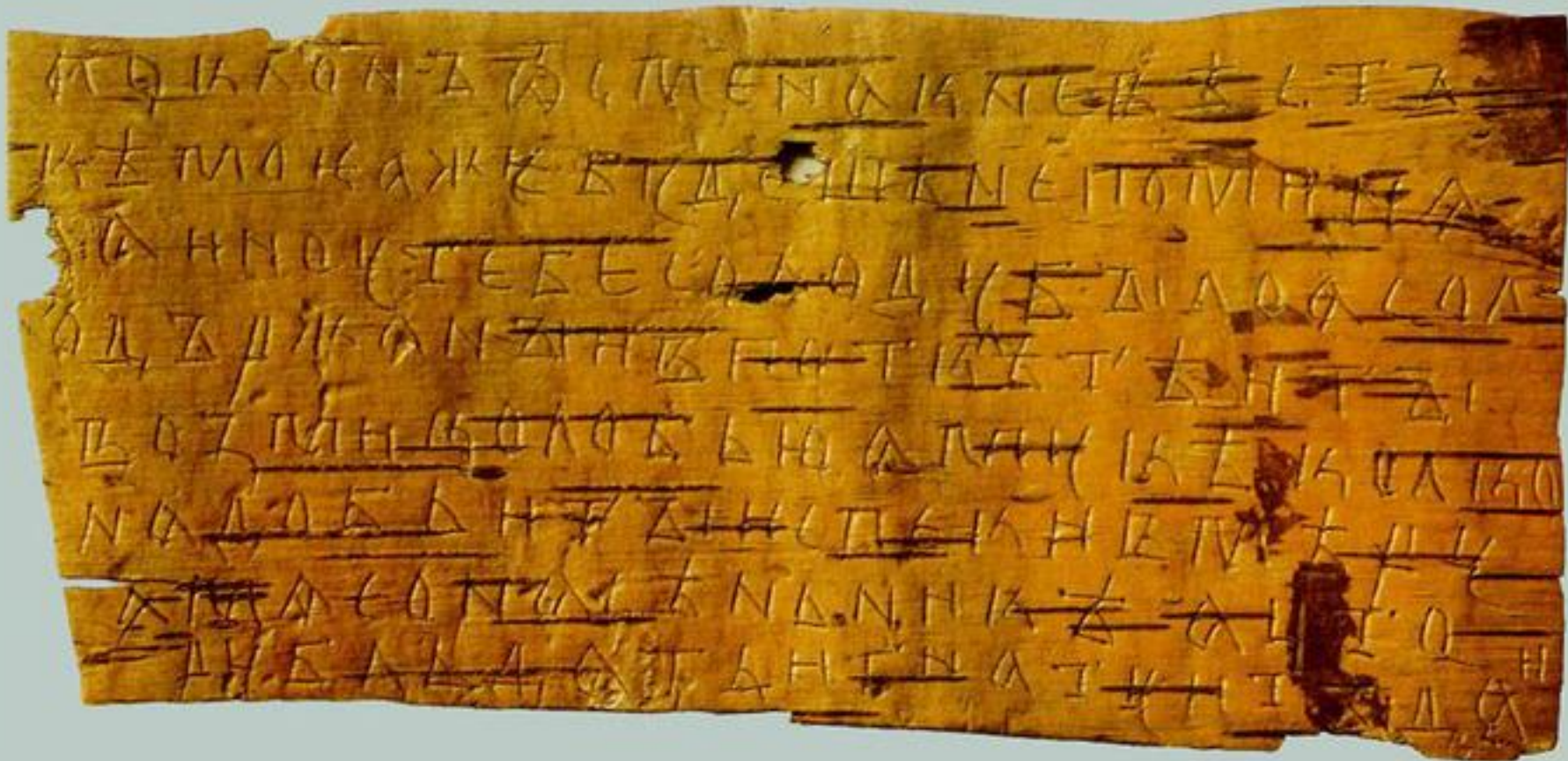
Новгородская берестяная грамота