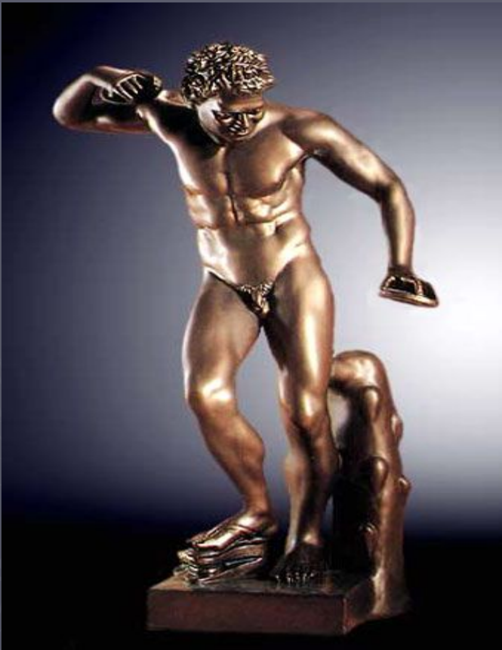
Грайливий фавн жов. 200 до н. е.. копія, Уффіці, Флоренція