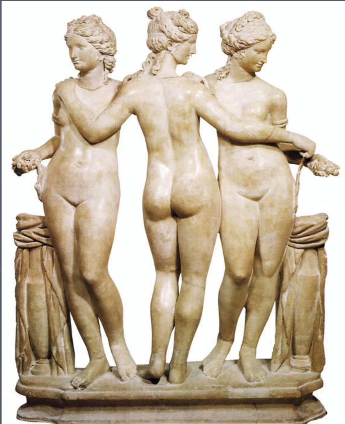
Богині Грації жов. 200 до н.е. Нац. музей Неаполь, Італія